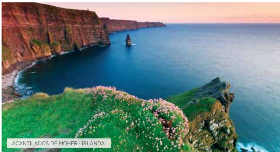
ACANTILADOS DE MOHER · IRLANDA