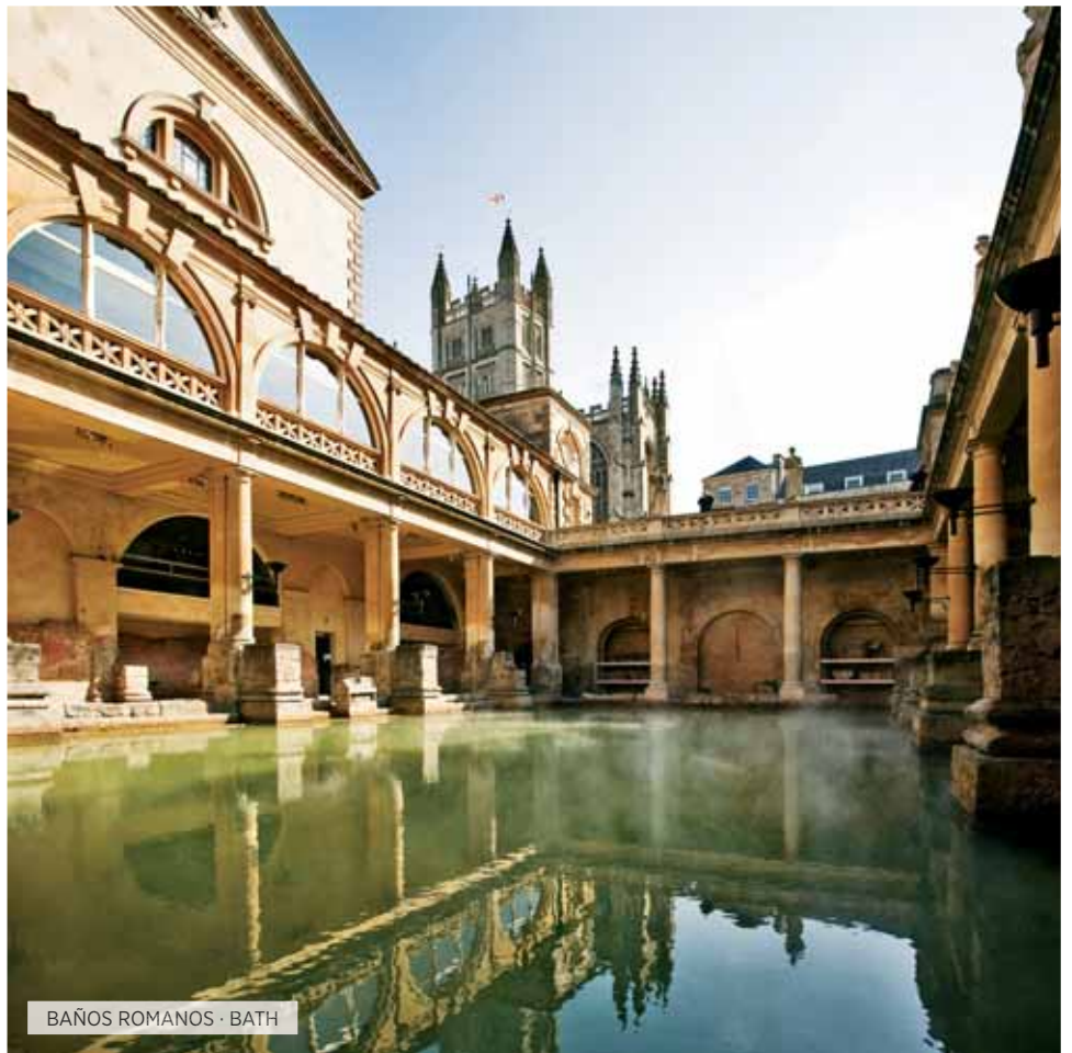
BAÑOS ROMANOS · BATH

Desayuno escocés. Abandonaremos las Tierras Altas, pasando en nuestro recorrido por Fort William, a orillas de Loch Linne, Glencoe, y la zona montañosa de los Trossachs hasta Stirling, donde visitaremos su castillo, uno de los más importantes de Escocia y lugar de refugio y coronación de la reina María Estuardo cuando solo era un bebé de pocos meses y testigo de algunas de las batallas escocesas de mayor relevancia, como Stirling Bridge, ganada por William Wallace en 1297, personaje popularizado por la película Braveheart, protagonizada por Mel Gibson y la de Bannockburn que supuso, en su momento, el reconocimiento de Escocia como nación independiente. Almuerzo. Continuación a Glasgow, considerada como uno de los mejores ejemplos de ciudad victoriana. Visita panorámica: la Catedral,