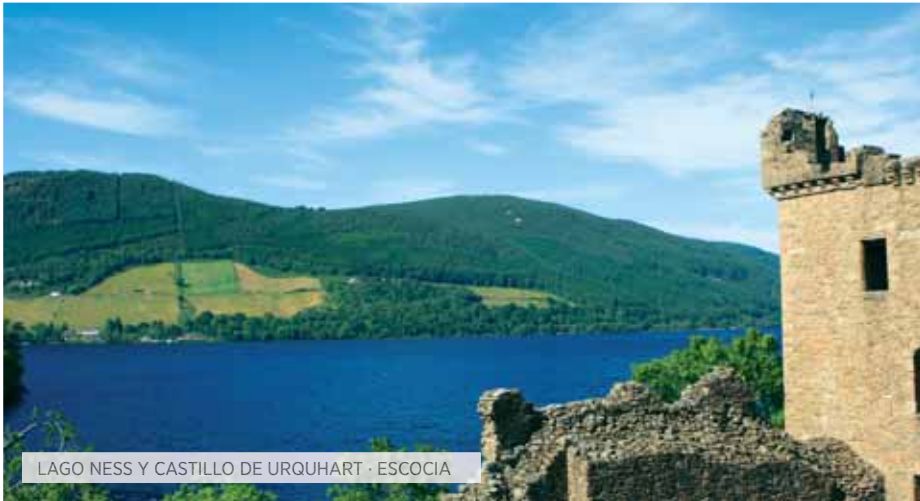
LAGO NESS Y CASTILLO DE URQUHART · ESCOCIA