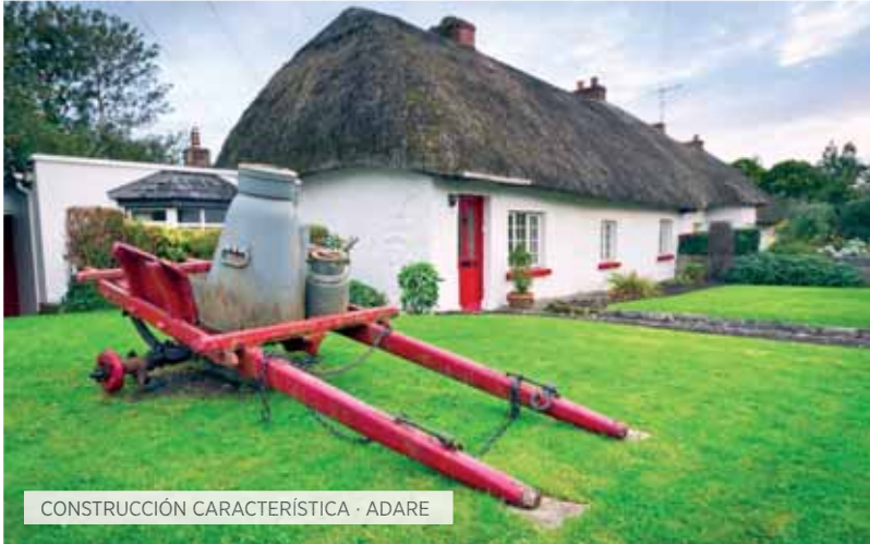
CONSTRUCCIÓN CARACTERÍSTICA · ADARE