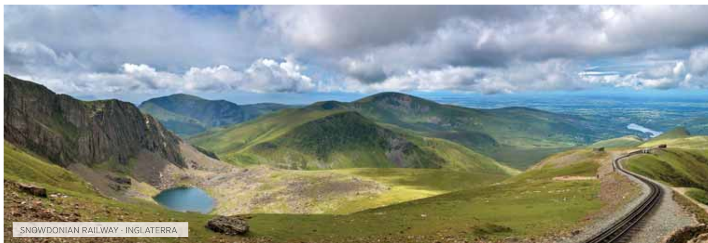
SNOWDONIAN RAILWAY · INGLATERRA