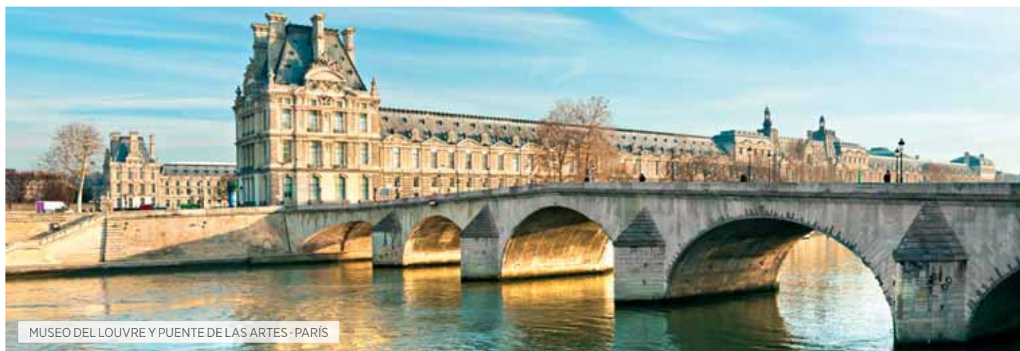
MUSEO DEL LOUVRE Y PUENTE DE LAS ARTES · PARÍS