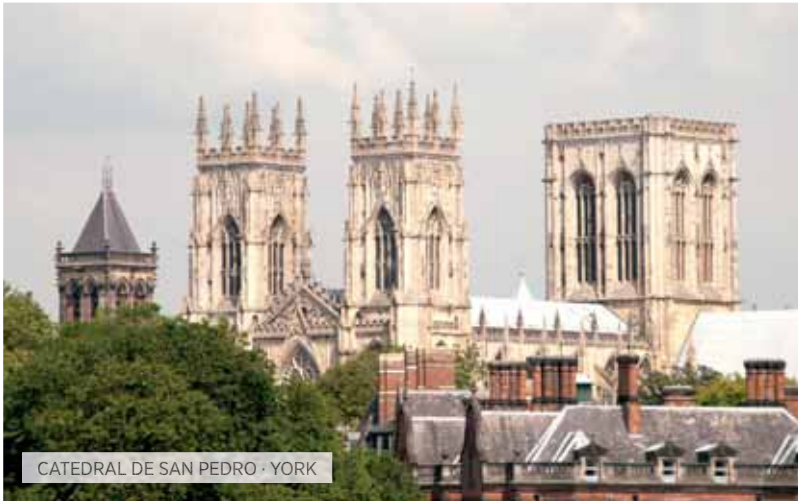
CATEDRAL DE SAN PEDRO - YORK