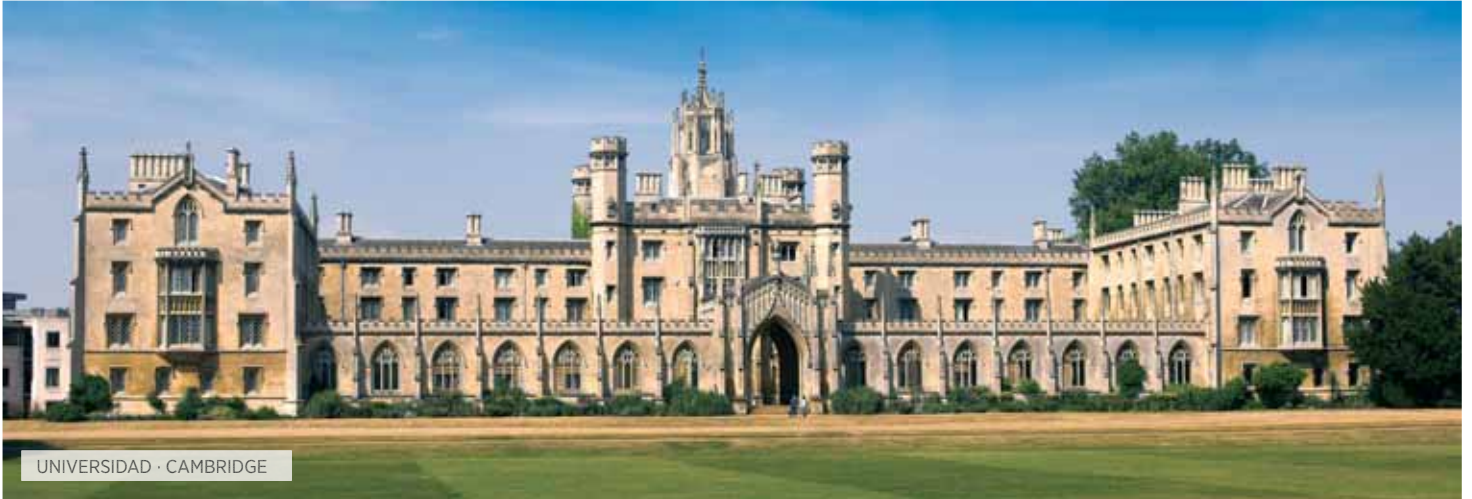
UNIVERSIDAD · CAMBRIDGE