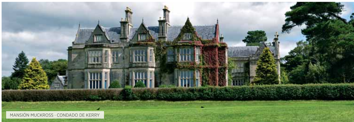
MANSIÓN MUCKROSS · CONDADO DE KERRY