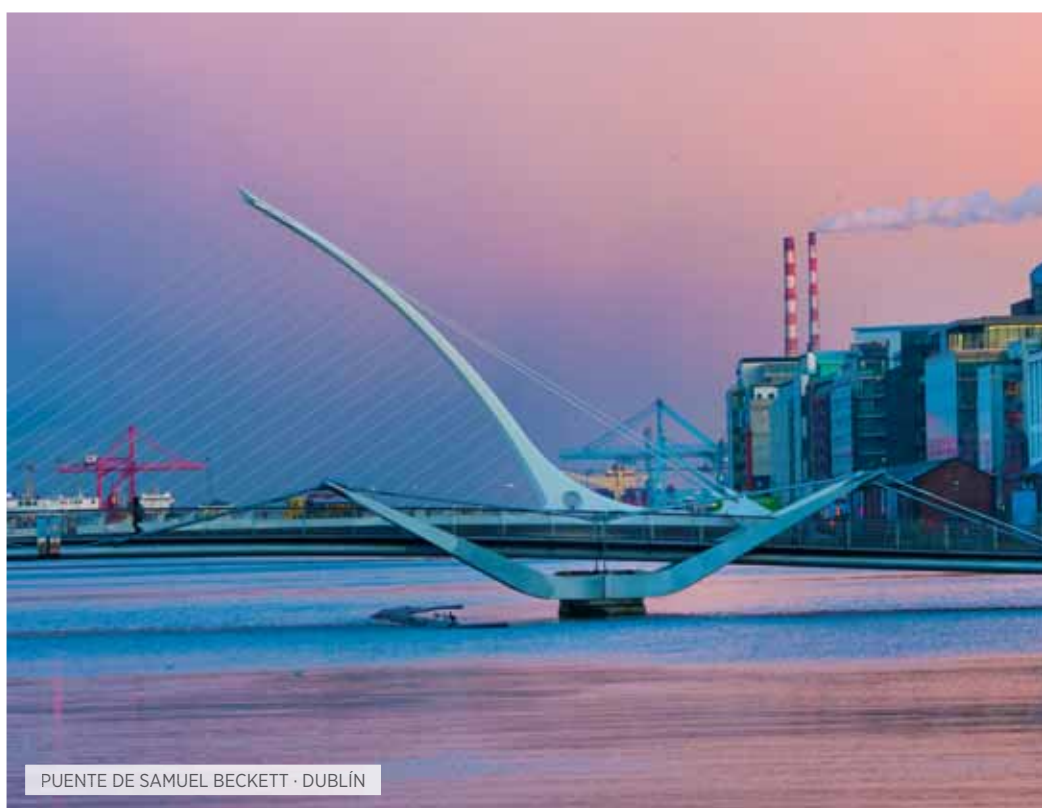
PUENTE DE SAMUEL BECKETT · DUBLÍN

Desayuno escocés. Abandonaremos las Tierras Altas, pasando en nuestro recorrido por Fort William, a orillas de Loch Linne, Glencoe, y la zona montañosa de los Trossachs hasta Stirling, donde visitaremos su castillo, uno de los más importantes de Escocia y lugar de refugio y coronación de la reina María Estuardo cuando solo era un bebé de pocos meses y testigo de algunas de las batallas escocesas de mayor relevancia, como Stirling Bridge, ganada por William Wallace en 1297, personaje popularizado por la película