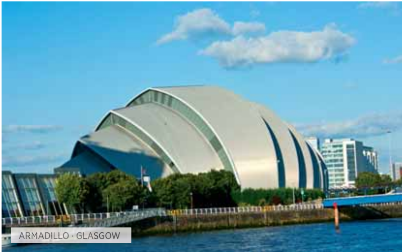
ARMADILLO · GLASGOW