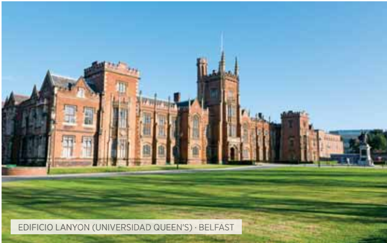
EDIFICIO LANYON (UNIVERSIDAD QUEEN'S) · BELFAST