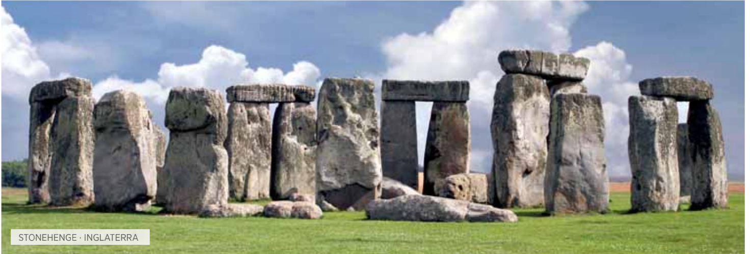
STONEHENGE · INGLATERRA