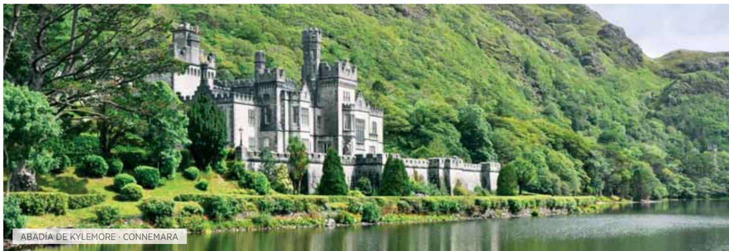
ABADÍA DE KYLEMORE · CONNEMARA