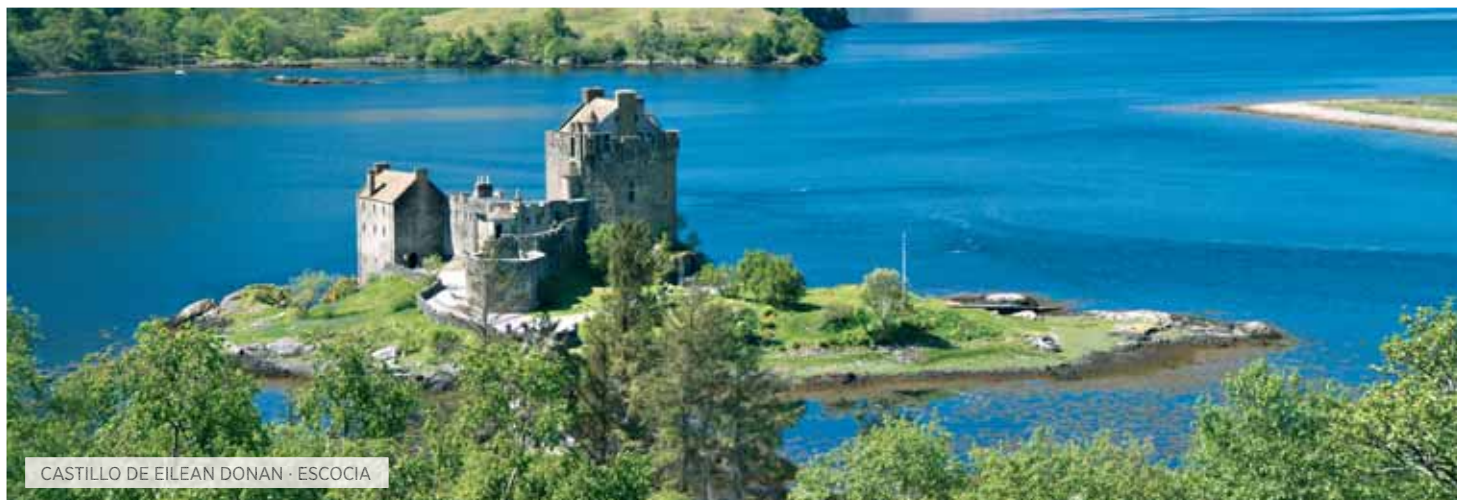
CASTILLO DE EILEAN DONAN · ESCOCIA