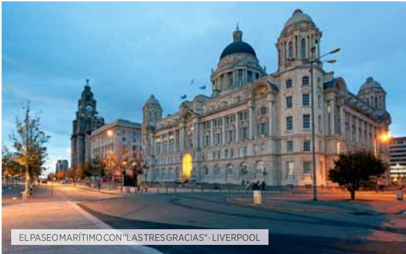
EL PASEO MARÍTIMO CON "LASTRES GRACIAS" · LIVERPOOL