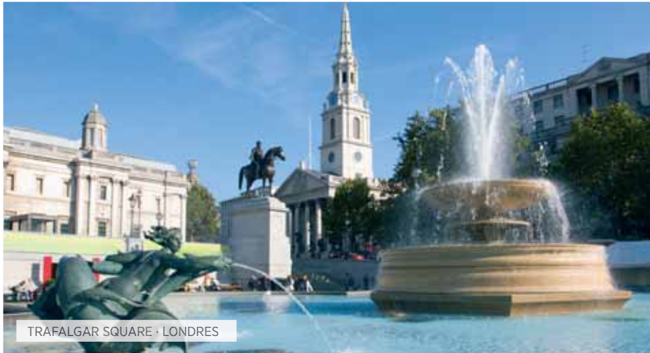
TRAFALGAR SQUARE · LONDRES