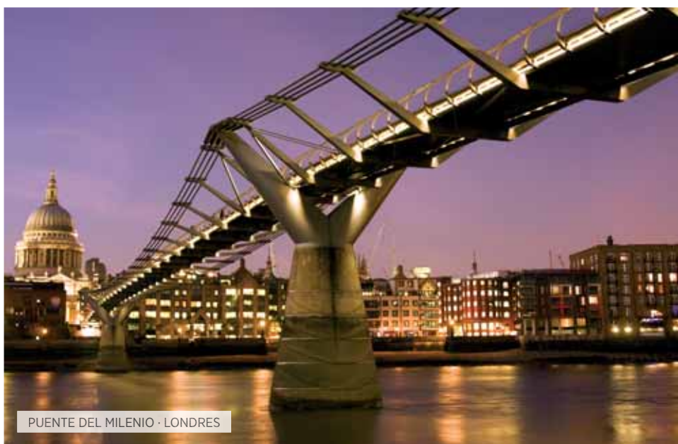
PUENTE DEL MILENIO · LONDRES

Desayuno irlandés. Salida por Adare, con casas de tejados de paja y su Abadía medieval, a Bunratty. Entrada al Castillo del S.XV, cuya importancia reside en que fue habitada por la familia O'Brien, quienes son considerados como los descendientes de Brian Ború, el último gran rey celta y también