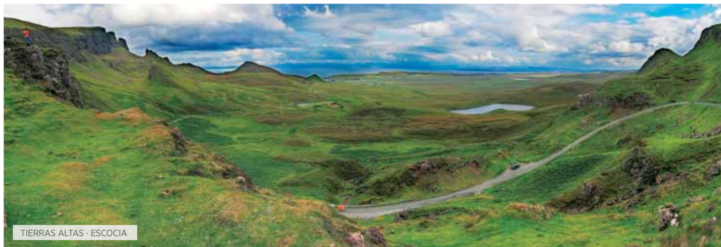
TIERRAS ALTAS · ESCOCIA