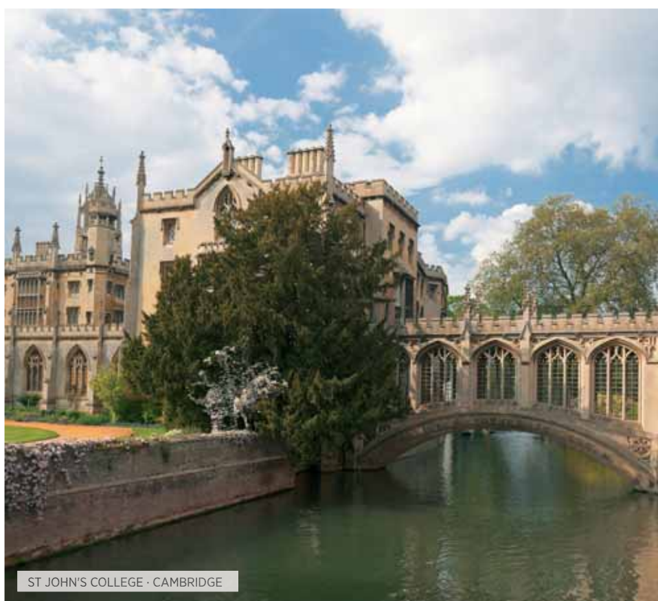
ST JOHN'S COLLEGE · CAMBRIDGE

Desayuno. Salida a Fountains Abbey, (entrada incluida), declarada Patrimonio de la Humanidad por la UNESCO. Un lugar maravilloso en que la belleza natural de su emplazamiento realza aún más esta abadía, fundada por los benedictinos en 1132, que fue la más importante de Gran Bretaña hasta el siglo XVI, en que Enrique VIII, decretó la disolución de los monasterios. Continuación hacia el noroeste de Inglaterra. Almuerzo en ruta. Llegaremos a la Región de los Lagos, el mayor parque nacional de Inglaterra y considerado uno de los lugares más hermosos de todo el país, en donde lagos y montañas se suceden en un ambiente de espectaculares paisajes. Realizaremos un paseo en barco por el Lago Windermere, el más importante y mayor de Inglaterra, en el corazón de la Región de Cumbria. Continuación a Liverpool, en donde por un lado, la popularidad de los Beatles y de su equipo el Liverpool Football Club, y sobre todo por ser el punto de partida para las excursiones hacia el Parque Nacional de Snowdonia, ha contribuido en convertir a esta ciudad en un importante destino turístico. Cena y alojamiento.