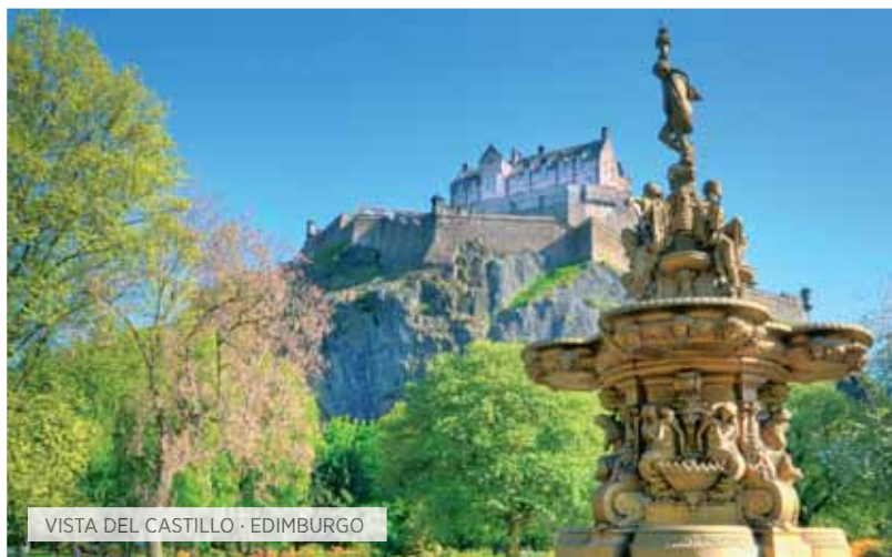
VISTA DEL CASTILLO · EDIMBURGO