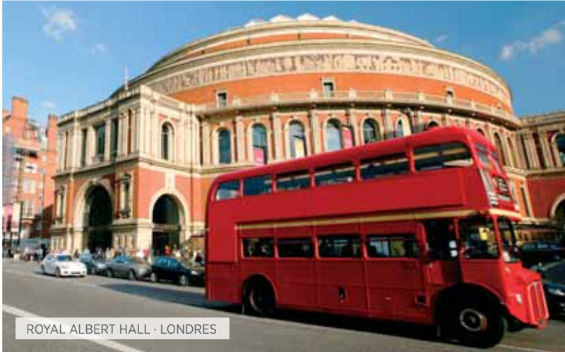
ROYAL ALBERT HALL · LONDRES