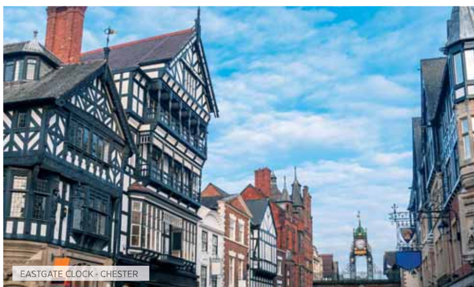
EASTGATE CLOCK · CHESTER

Desayuno escocés. Excursión por la región de las Tierras Altas. Recorreremos el Wester Ross, una de las rutas más impresionantes hacia la costa, divisando montañas, tranquilos lochs y recónditas playas. Bordeando el Loch Maree, y vía Gairloch, llegada a los Inverewe Gardens, jardines subtropicales en la misma latitud que San Petersburgo, bajo la cálida influencia de la corriente del Golfo. Continuación a The Falls of Measach, con breve parada para ver la cascada.