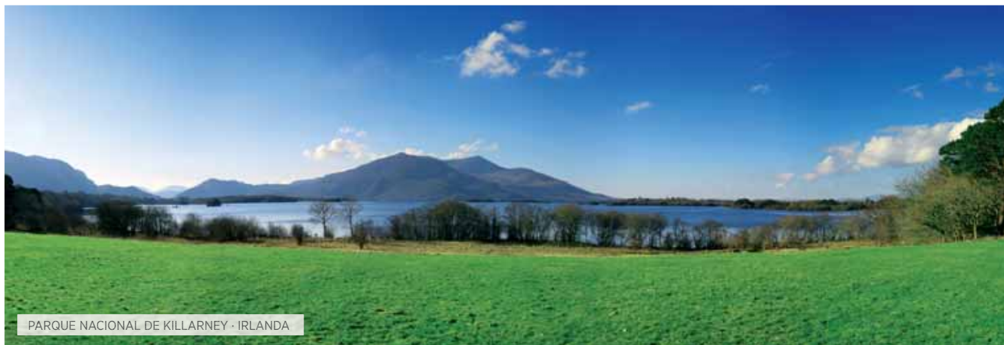
PARQUE NACIONAL DE KILLARNEY · IRLANDA