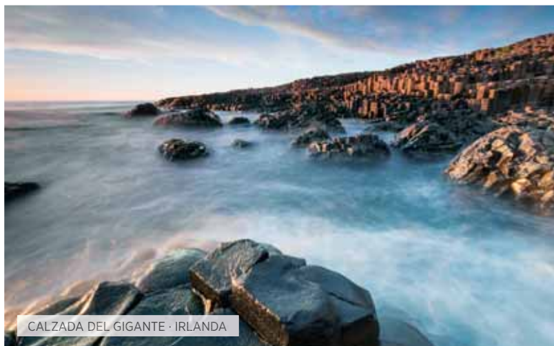
CALZADA DEL GIGANTE · IRLANDA