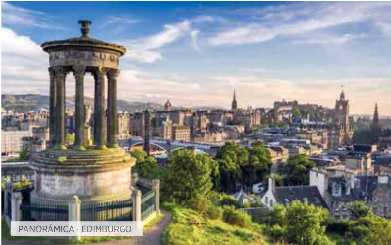
PANORÁMICA · EDIMBURGO