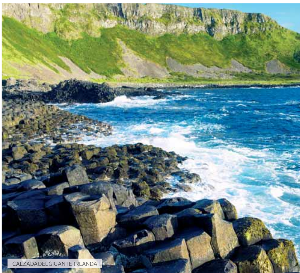
CALZADA DEL GIGANTE · IRLANDA

Desayuno irlandés. Salida por Adare, con casas de tejados de paja y su Abadía medieval, a Bunratty. Entrada al Castillo del S.XV, cuya importancia reside en que fue habitada por la familia O'Brien, quienes son considerados como los des-