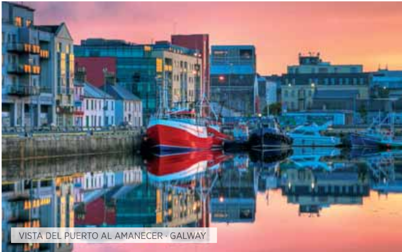
VISTA DEL PUERTO AL AMANECER · GALWAY