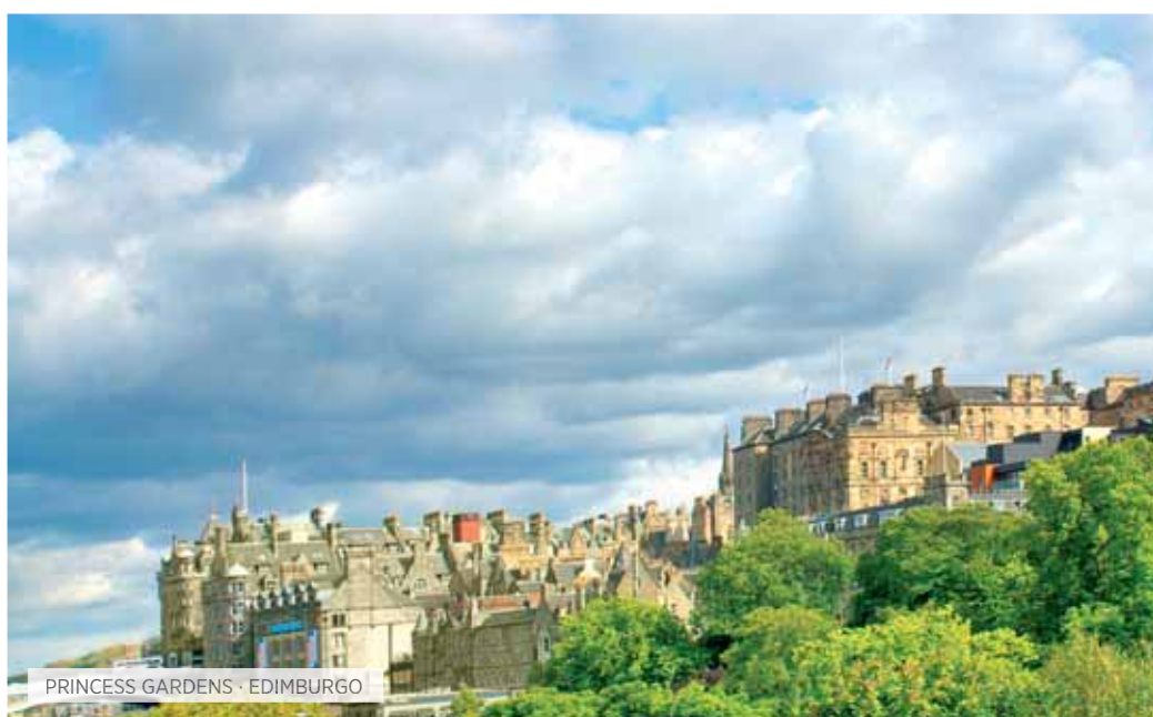
PRINCESS GARDENS · EDIMBURGO

Desayuno escocés. Excursión por la región de las Tierras Altas. Recorreremos el Wester Ross, una de las rutas más impresionantes hacia la costa, divisando montañas, tranquilos lochs y recónditas playas. Borneando el Loch Maree, y vía Gairloch, llegada a los Inverewe Gardens, jardines subtropicales en la misma latitud que San Petersburgo, bajo la cálida influencia de la corriente del Golfo. Continuación a The Falls of Measach, con breve parada para ver la cascada.