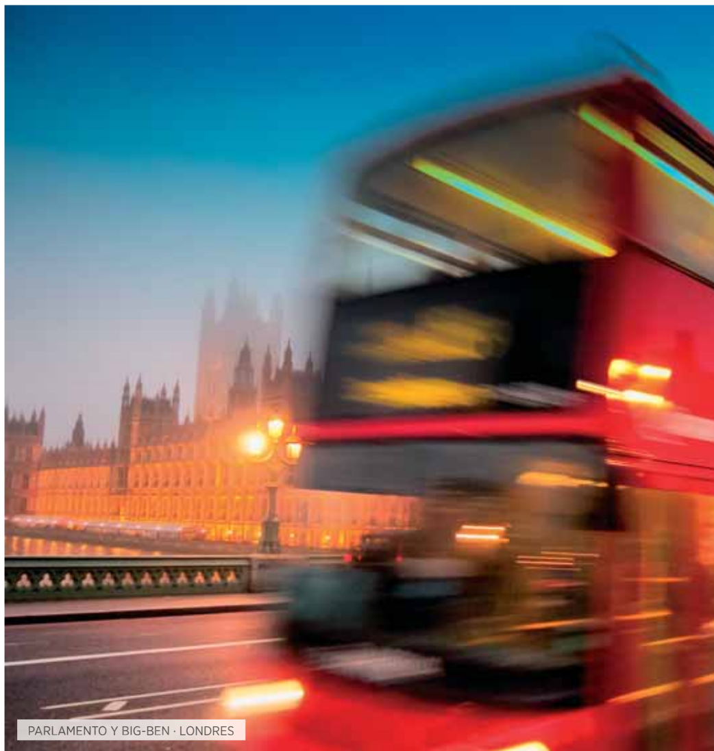
PARLAMENTO Y BIG-BEN · LONDRES

Desayuno. Salida hacia Cambridge y tiempo libre para pasear por esta ciudad universitaria que está considerada como uno de los conjuntos en estilo Tudor mejores de Gran Bretaña: Trinity College, Queens College, Iglesia de Santa María, etc. Continuación a York. Fundada en el año 17 a.C. por los romanos, siendo la capital del Imperio durante un par de años cuando Septimio Severo la convirtió en una de las dos capitales y se trasladó hasta aquí para controlar el avance de sus legiones por estas tierras. Realizaremos una visita guiada de esta ciudad que posee una arquitec-