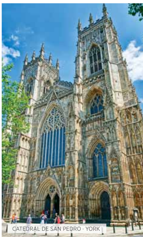
CATEDRAL DE SAN PEDRO · YORK

Desayuno. Excursión a Gales donde conoceremos el Parque Nacional de Snowdonia. En Llanberis, tomaremos el