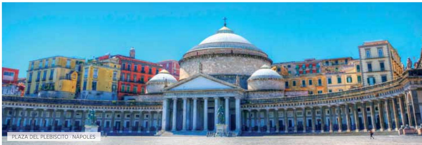
PLAZA DEL PLEBISCITO · NÁPOLES