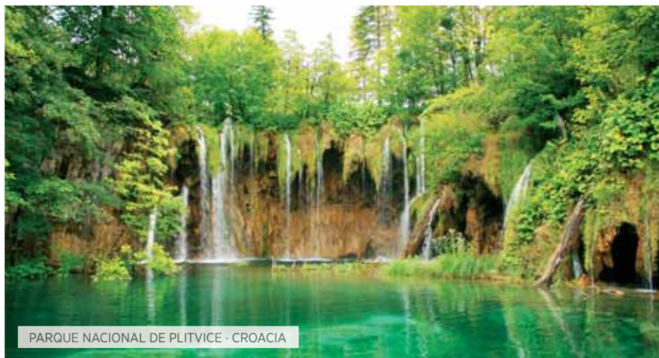
PARQUE NACIONAL DE PLITVICE · CROACIA