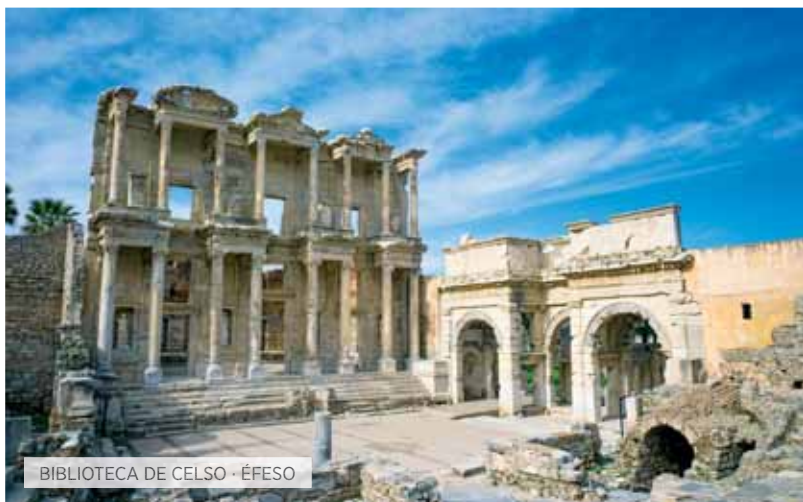
BIBLIOTECA DE CELSO - ÉFESO