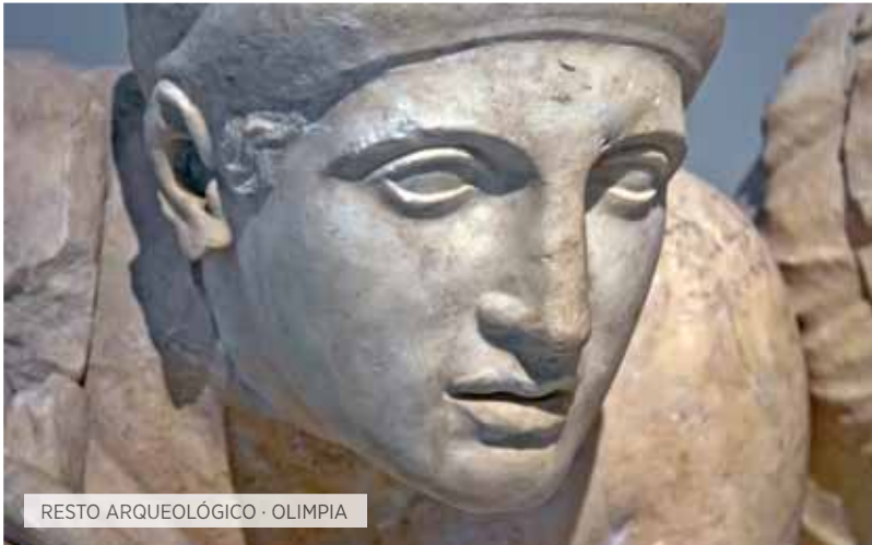
RESTO ARQUEOLÓGICO · OLIMPIA