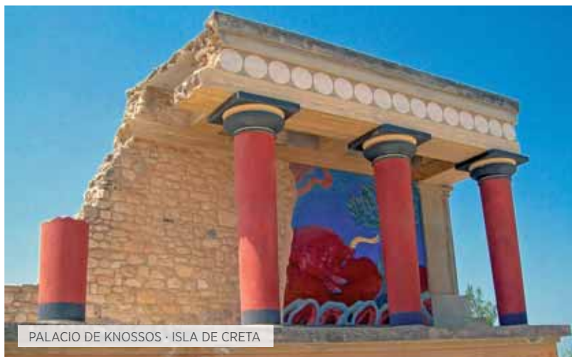
PALACIO DE KNOSSOS · ISLA DE CRETA