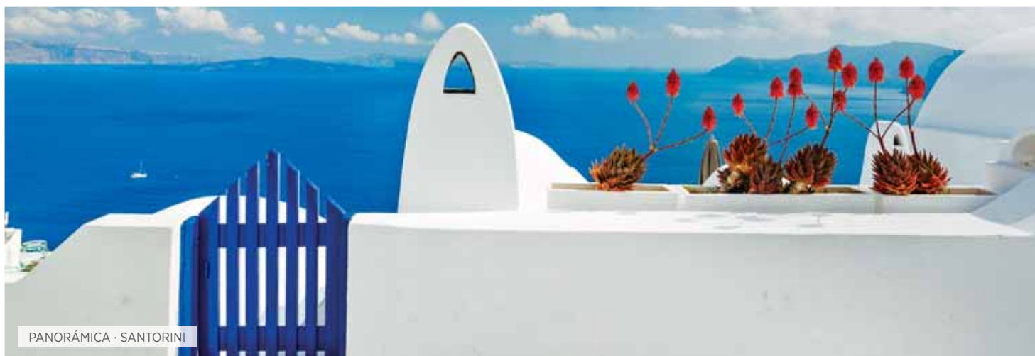
PANORÁMICA · SANTORINI