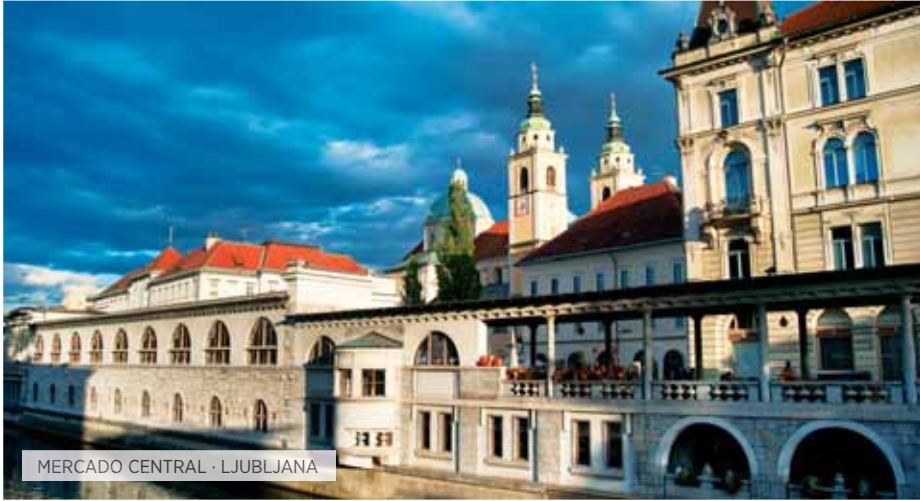
MERCADO CENTRAL · LJUBLJANA