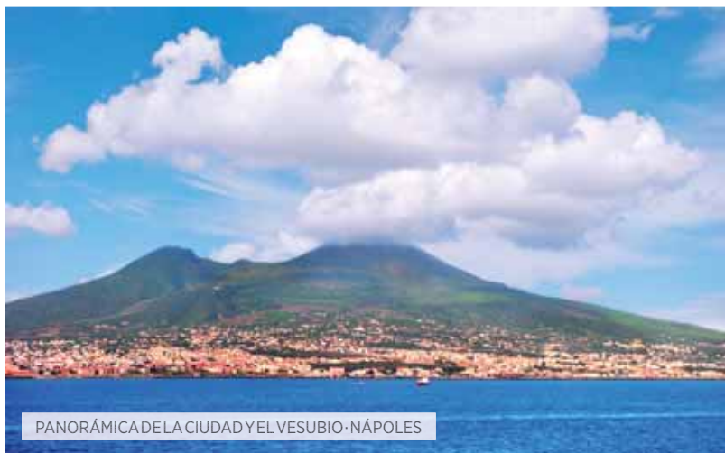
PANORÁMICA DE LA CIUDAD Y EL VESUBIO · NÁPOLES