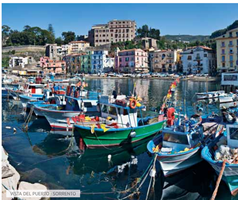
VISTA DEL PUERTO · SORRENTO

Desayuno. Por la mañana, salida hacia Piazza Armerina: visita de la espléndida Villa Romana del Casale, lujosa morada, que se encuentra en el corazón de Sicilia, importante ejemplo de la época romana y donde se pueden admirar los preciosos mosaicos. Continuación hacia Ragusa. Almuerzo. Por la tarde visita de esta maravillosa ciudad barroca y en particular del casco antiguo, Ragusa Ibla, que forma parte