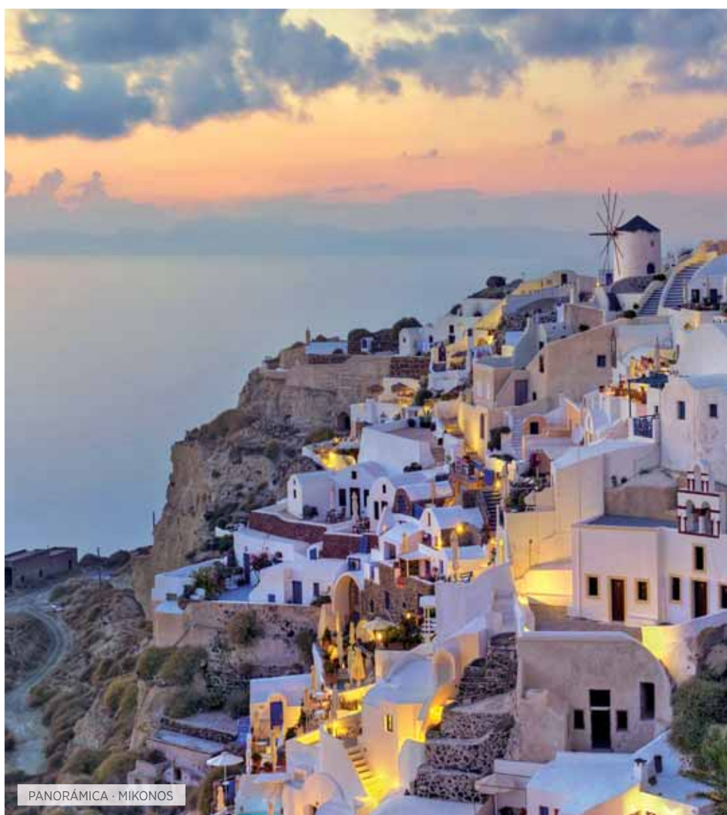
PANORÁMICA · MIKONOS

Desayuno. Visita del Estadio, del Templo de Zeus y demás instalaciones olímpicas. Seguidamente visitaremos el Museo, donde podrá contemplar, entre otras cosas, la maqueta del Santuario de Zeus, los frontones del Templo y la famosa estatua de Hermes de Praxiteles. Almuerzo y salida hacia Delfos pasando por Patras. Continuación, atravesando el estrecho de Rion, por el puente colgante Jarilus Tricupis (es el más largo del mundo) sobre el mar Jónico. Continuación a Lepanto y de allí a Delfos. Cena y alojamiento.