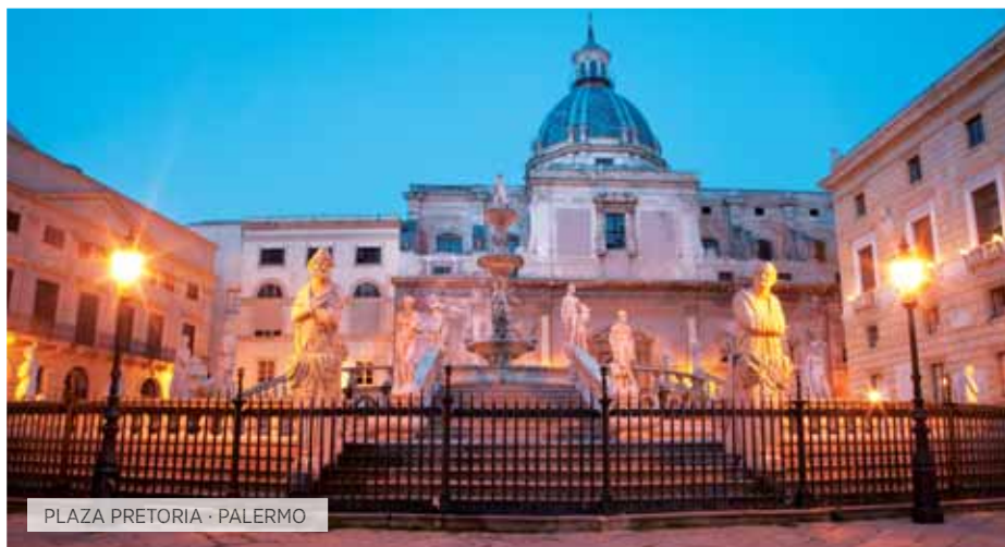
PLAZA PRETORIA · PALERMO