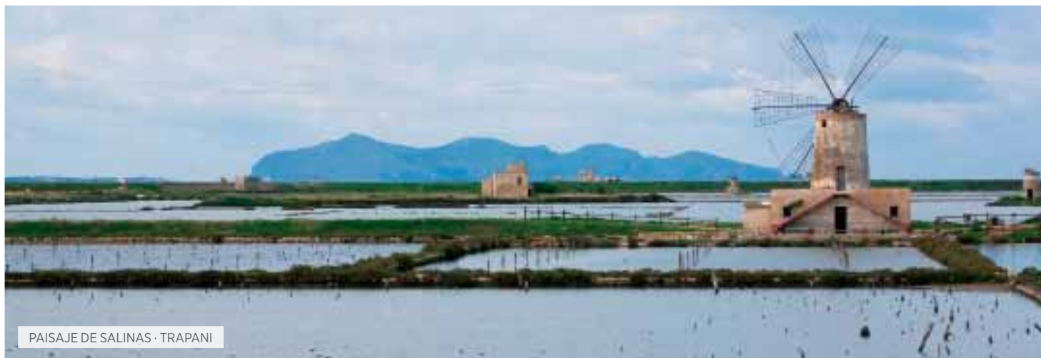
PAISAJE DE SALINAS · TRAPANI