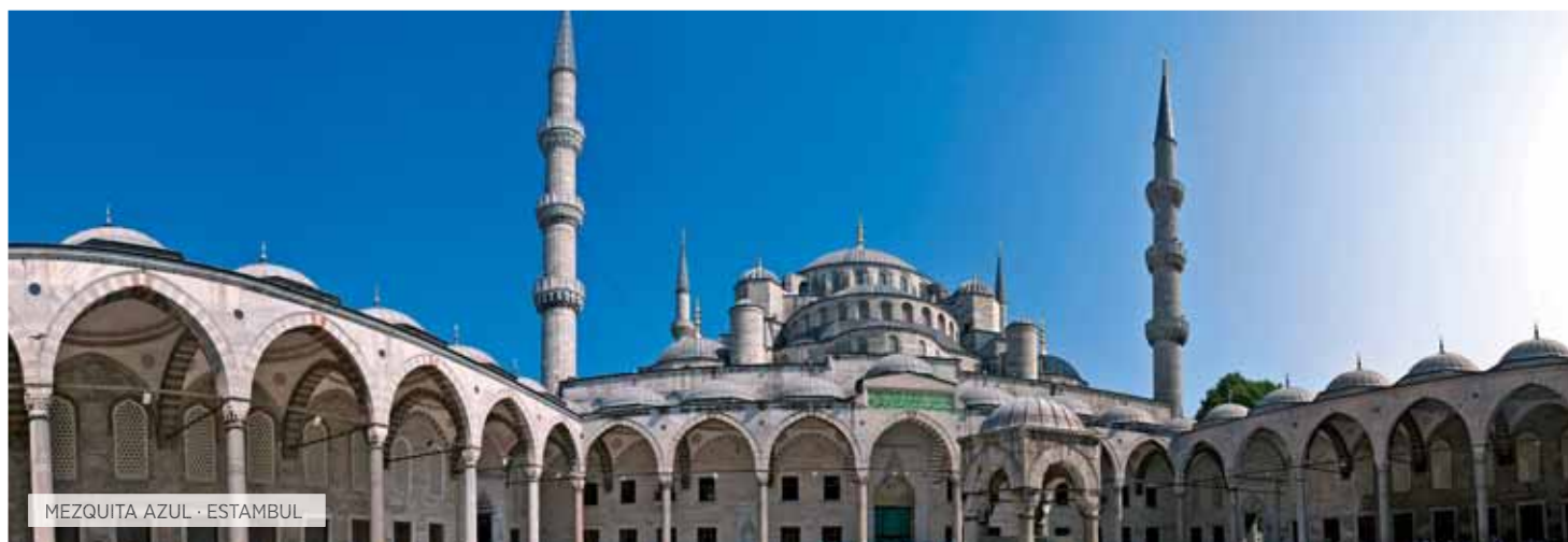
MEZQUITA AZUL · ESTAMBUL