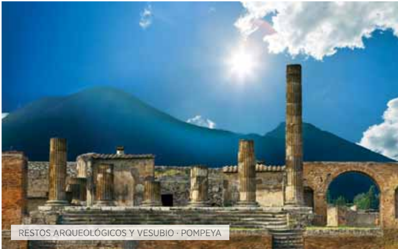
RESTOS ARQUEOLÓGICOS Y VESUBIO - POMPEYA