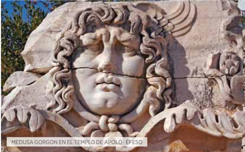
MEDUSA GORGON EN EL TEMPLO DE APOLO · ÉFESO