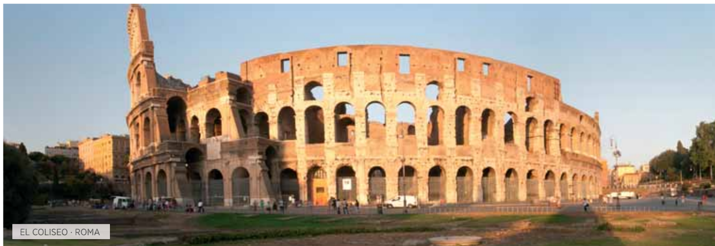
EL COLISEO · ROMA