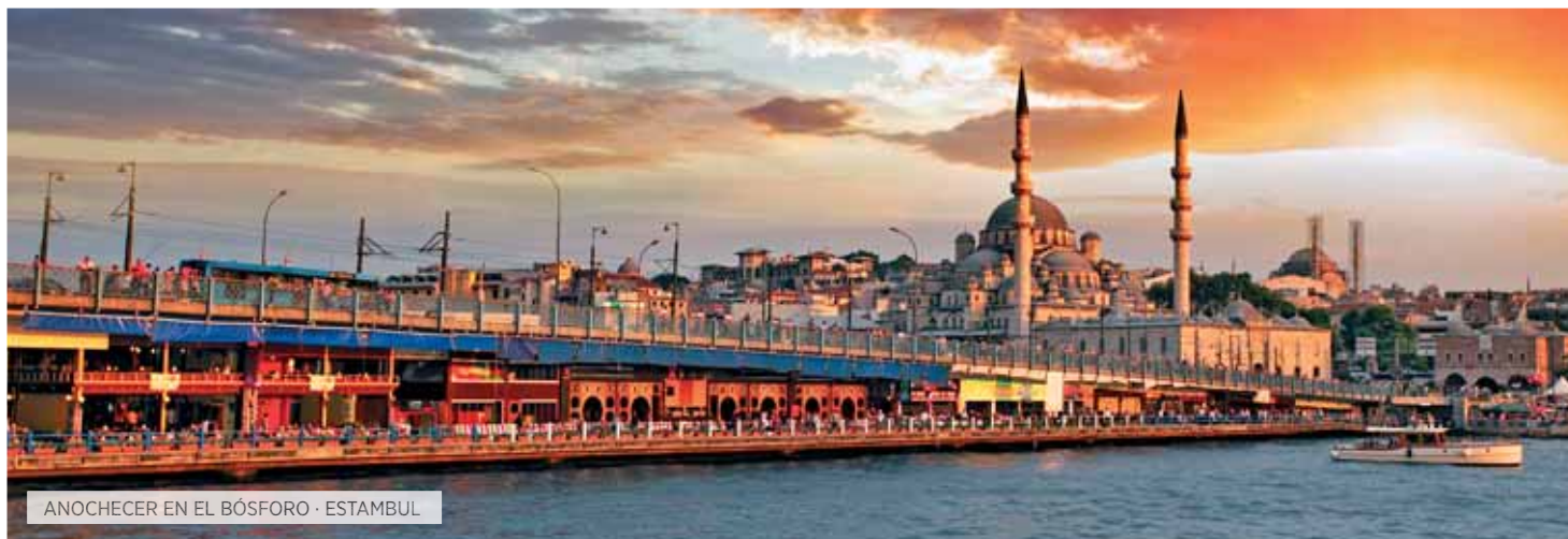
ANOCHECER EN EL BÓSFORO · ESTAMBUL