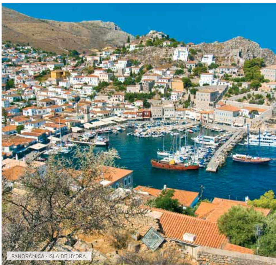
PANORÁMICA · ISLA DE HYDRA

Desayuno. Salida hacia Ankara, la capital de Turquía. Visita panorámica de la ciudad: el Museo Hitita o de las Civiliza-