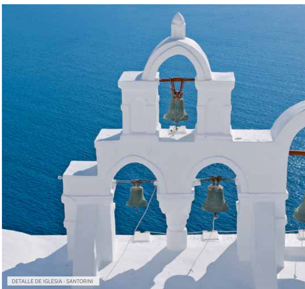
DETALLE DE IGLESIA - SANTORINI

Desayuno. Visita del Estadio, del Templo de Zeus y demás instalaciones olímpicas. Seguidamente visitaremos el Museo, donde podrá contemplar, entre otras cosas, la maqueta del Santuario de Zeus, los frontones del Templo y la famosa estatua de Hermes de Praxiteles. Almuerzo y salida hacia Delfos pasando por Patras. Continuación, atravesando el estrecho de Rion, por el puente colgante Jarilus Tricupis (es el más largo del mundo) sobre el mar Jónico. Continuación a Lepanto y de allí a Delfos. Cena y alojamiento.