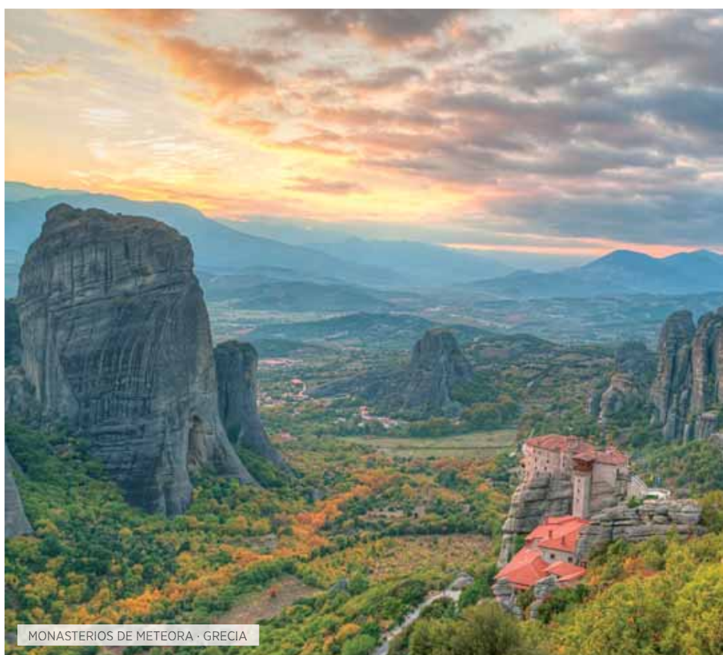
MONASTERIOS DE METEORA · GRECIA

Desayuno. Visita del sitio Arqueológico de Delfos con el museo. Continuación al monasterio de Ossios Lukas (Santo Lucas). Aquí visitaremos las tres iglesias bizantinas de los