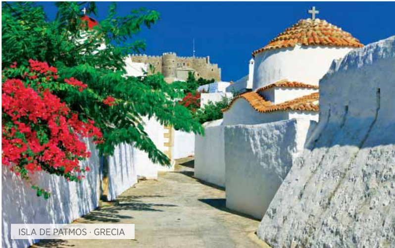
ISLA DE PATMOS · GRECIA