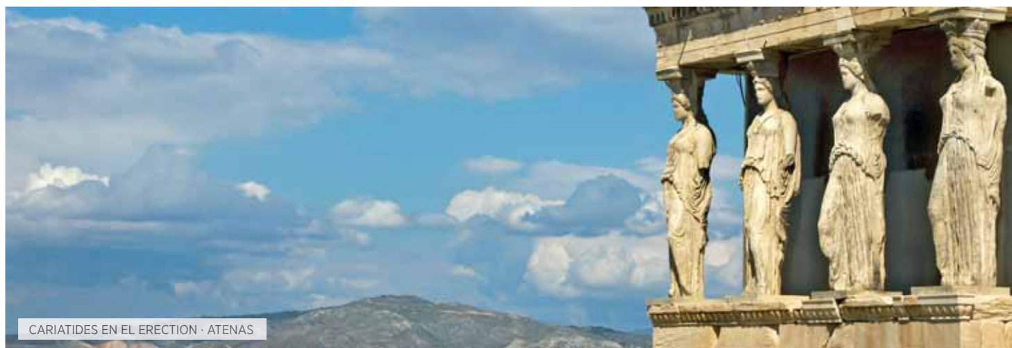
CARIATIDES EN EL ERECTION - ATENAS