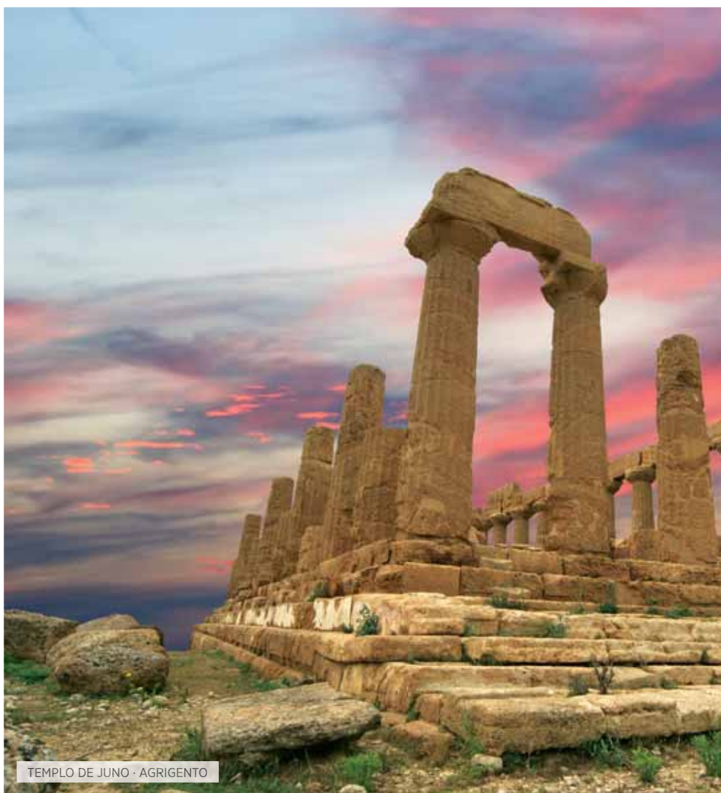
TEMPLO DE JUNO · AGRIGENTO

Desayuno. Por la mañana, salida hacia Piazza Armerina: visita de la espléndida Villa Romana del Casale, lujosa morada, que se encuentra en el corazón de Sicilia, importante ejemplo de la época romana y donde se pueden admirar los preciosos mosaicos. Continuación hacia Ragusa. Almuerzo. Por la tarde visita de esta maravillosa ciudad barroca y en particular del casco antiguo, Ragusa Ibla, que forma parte de las "Ciudades del barroco tardío de Val di Noto", que fue declarado Patrimonio de la Humanidad por la UNESCO en el año 2002. Además realizaremos una pequeña degustación del famoso chocolate Modicano,