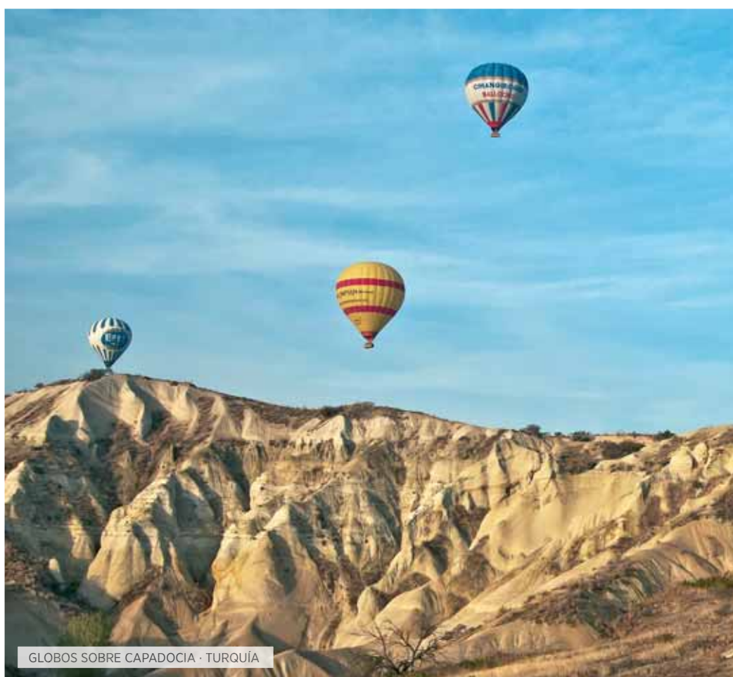
GLOBOS SOBRE CAPADOCIA · TURQUÍA

Desayuno. Salida hacia Ankara, la capital de Turquía. Visita panorámica de la ciudad: el Museo Hitita o de las Civilizaciones Anatólicas, para conocer la historia y cultura de estos pueblos, y del Mausoleo de Atatürk, fundador y primer presidente de la moderna República de Turquía. Cena y alojamiento.