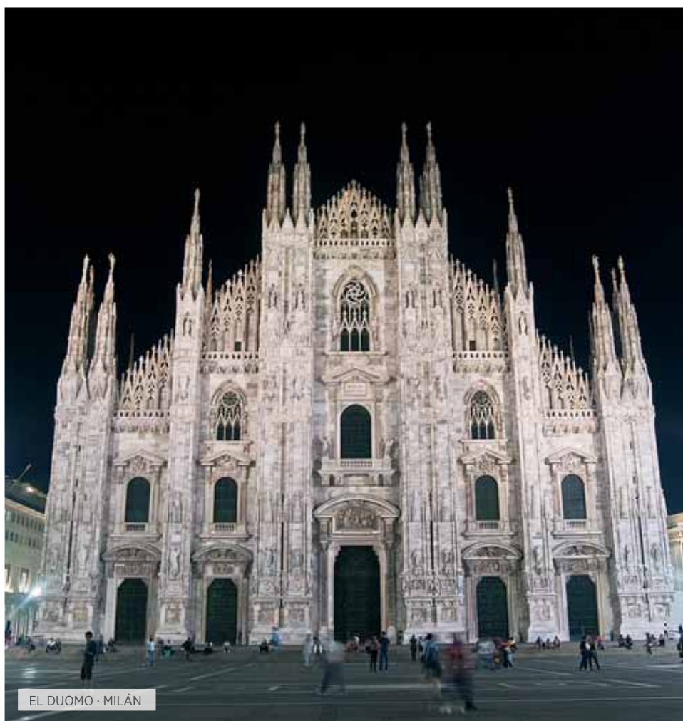
EL DUOMO · MILÁN

Desayuno. Por la mañana, salida hacia Piazza Armerina: visita de la espléndida Villa Romana del Casale, lujosa morada, que se encuentra en el corazón de Sicilia, importante ejemplo de la época romana y donde se pueden admirar los preciosos mosaicos. Continuación hacia Ragusa. Almuerzo. Por la tarde visita de esta maravillosa ciudad barroca y en particular del casco antiguo, Ragusa Ibla, que forma parte de las "Ciudades del barroco tardío de Val di Noto", que fue declarado Patrimonio de la Humanidad por la UNESCO en el año 2002. Además realizaremos una pequeña degustación del famoso chocolate Modicano, realizado todavía