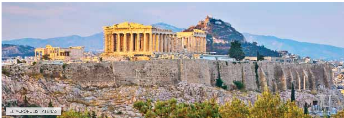
EL ACRÓPOLIS · ATENAS