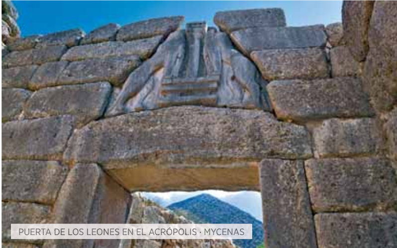
PUERTA DE LOS LEONES EN EL ACRÓPOLIS · MYCENAS