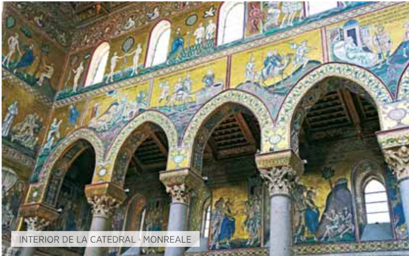
INTERIOR DE LA CATEDRAL · MONREALE