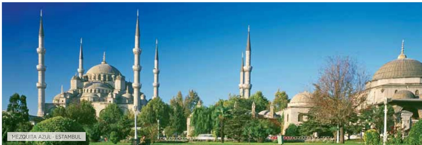
MEZQUITA AZUL · ESTAMBUL