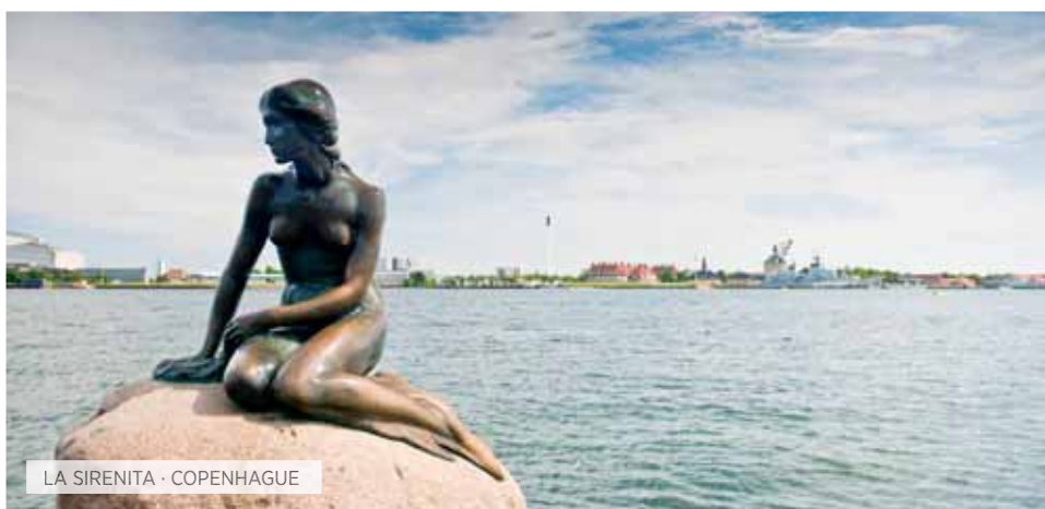
LA SIRENITA · COPENHAGUE

Desayuno y salida hacia la famosa Colina de las Cruces, importante lugar de culto católico del país, con cruces erigidas desde el S.XIV. Durante la época soviética el ejército destruyó más de 2,000 y se consideró un delito, colocarlas en ese lugar. Sin embargo, las cruces siguieron creciendo en la colina para asombro de los rusos. A finales de la época soviética la colina contaba con más de 40,000. Seguidamente atravesaremos la frontera con Letonia para llegar al Palacio de Rundalé, uno de los más sobresalientes edificios del Barroco y Rococó letón, construido entre 1736 y 1740 como residencia de verano de Ernst Johann Biron, Duque de Courland, sobre planos y diseño del arquitecto Francesco Bartolomeo Rastrelli diseñador a su vez, del Palacio de Invierno de San Petersburgo, ya que era el arquitecto favorito de la zarina Catalina la Grande. Almuerzo y visita del interior del palacio. Continuación a Riga, capital de Letonia, fundada por el obispo alemán Albert en 1201. Alojamiento.