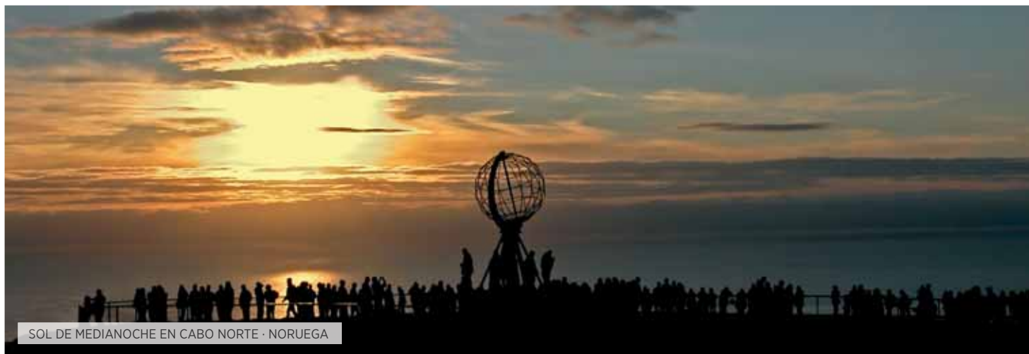
SOL DE MEDIANOCHE EN CABO NORTE · NORUEGA