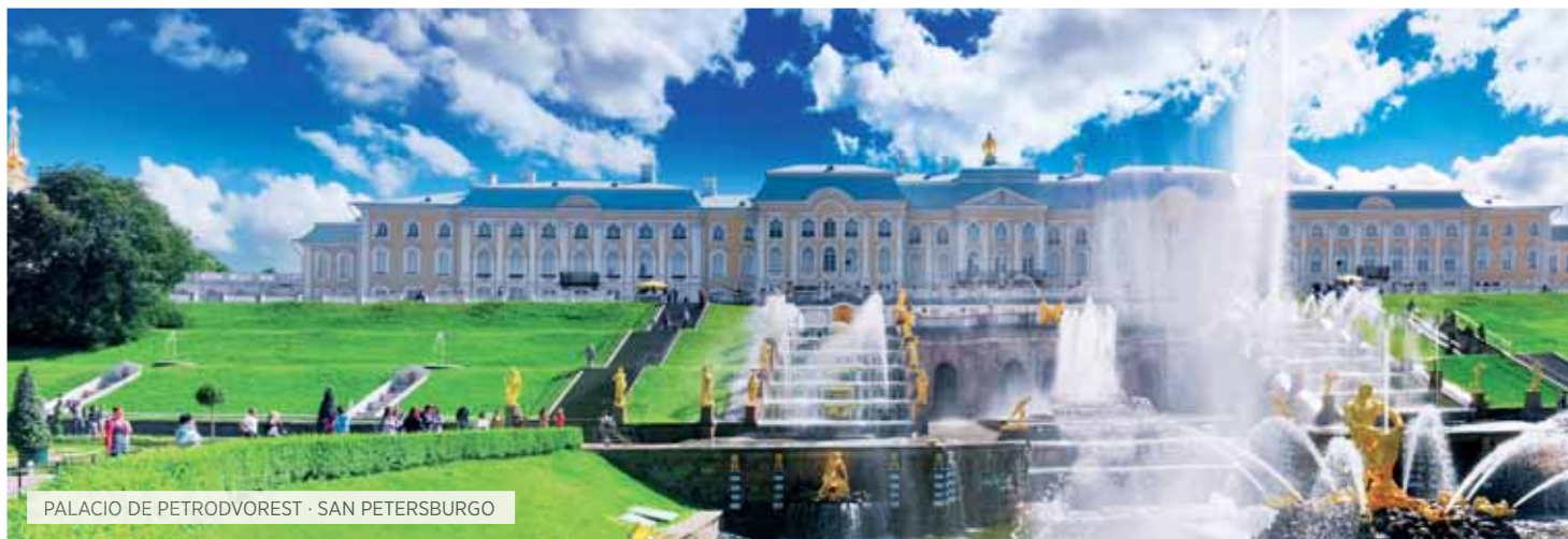
PALACIO DE PETRODVOREST · SAN PETERSBURGO