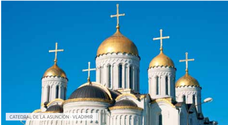
CATEDRAL DE LA ASUNCIÓN · VLADIMIR

OTI Opción Todo Incluido S Special Selección