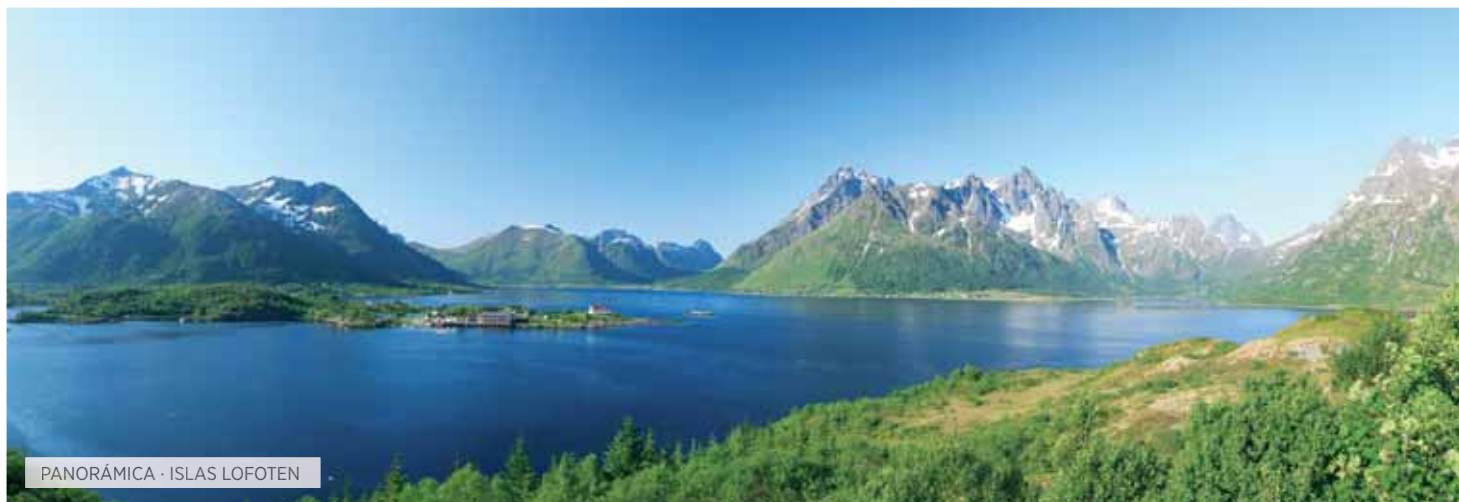
PANORÁMICA · ISLAS LOFOTEN