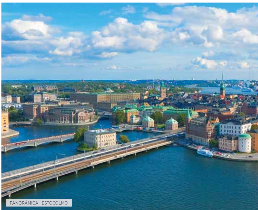
PANORÁMICA · ESTOCOLMO

Desayuno. Hoy nos espera un día inolvidable en el que realizaremos una excursión al Glaciar de Briksdal, situado en el Parque Nacional de Jostedalbreen, recomendamos calzado apropiado, ya que realizaremos una bellísima ruta de senderismo en el que disfrutaremos de la naturaleza, rodeados de montañas, cascadas y una riquísima vegetación hasta llegar a la lengua del glaciar. Una experiencia que dura unas horas, pero que conservará toda la vida en su memoria. Almuerzo. A continuación, si las condiciones meteorológicas lo permiten, realizaremos una excursión opcional en helicóptero, sobrevolando esta zona de fiordos