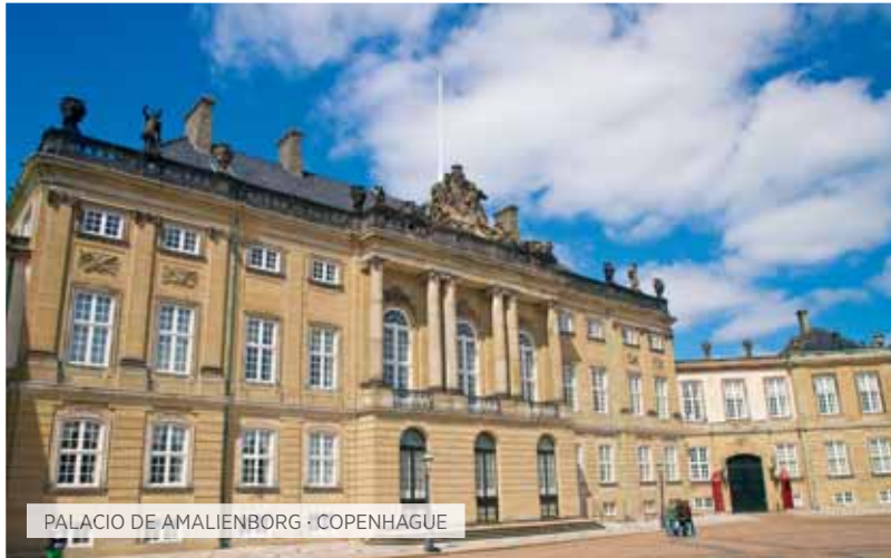
PALACIO DE AMALIENBORG · COPENHAGUE