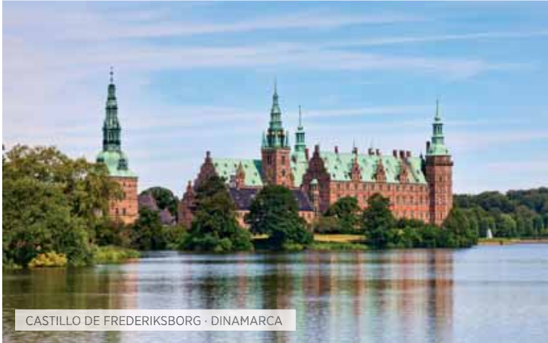
CASTILLO DE FREDERIKSBORG · DINAMARCA