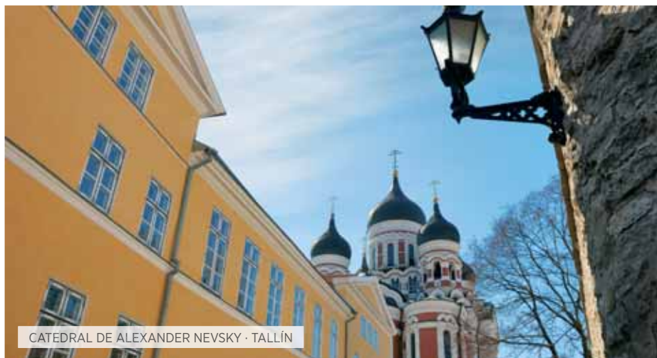
CATEDRAL DE ALEXANDER NEVSKY · TALLÍN