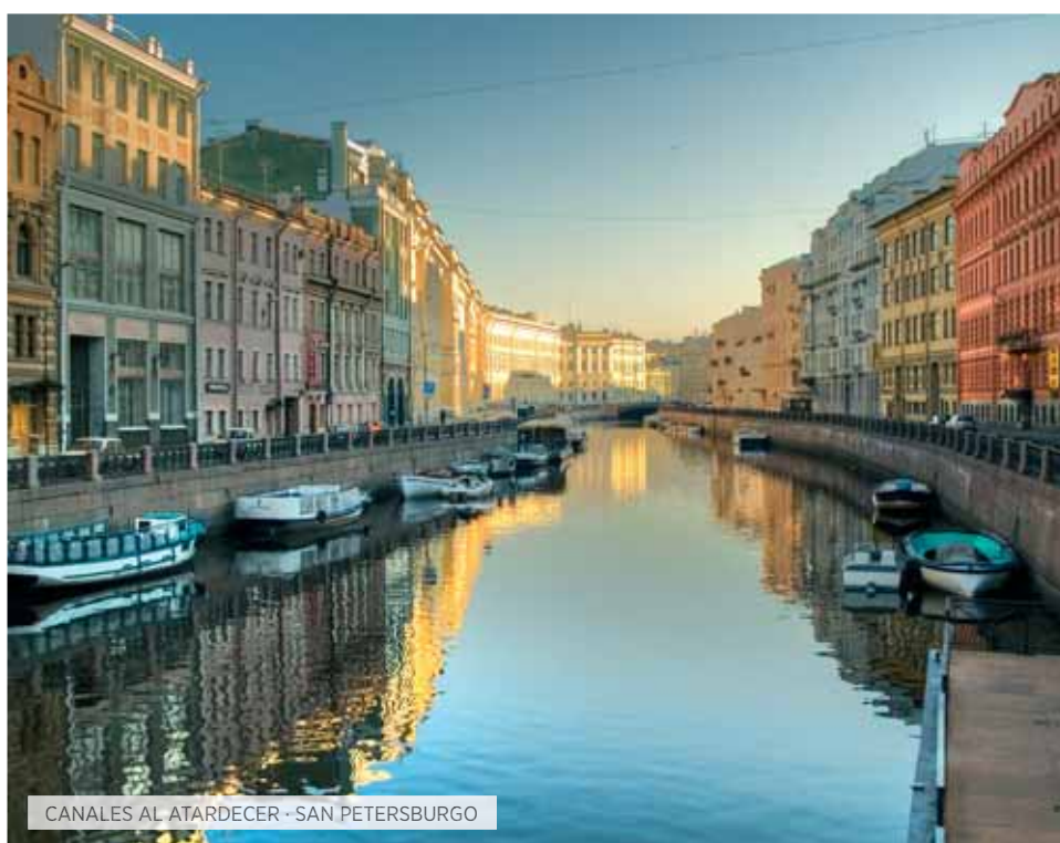
CANALES AL ATARDECER · SAN PETERSBURGO

Desayuno y día libre. Posibilidad de realizar una visita ( Opción TI ) al Kremlin, antigua residencia de los zares, con las catedrales de la Anunciación y de la Asunción, en ella se coronaban los zares y la de San Miguel Arcángel, en la cual están enterrados numerosos zares. ( Cena Opción TI ). Al final del día, traslado a la estación de ferrocarril para tomar un tren nocturno con destino San Petersburgo. Alojamiento en compartimentos cuádruples (opción en dobles, triples o individuales).