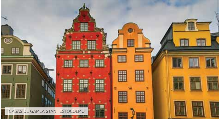
CASAS DE GAMLA STAN · ESTOCOLMO