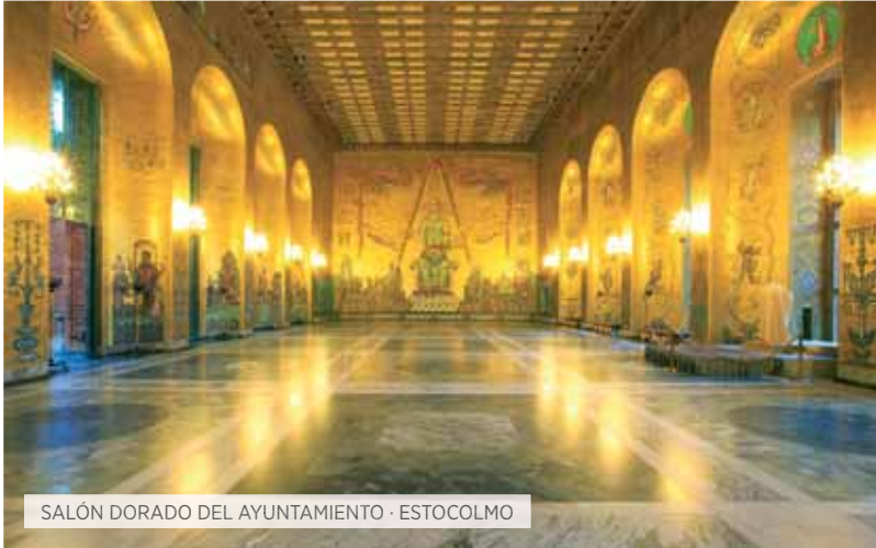
SALÓN DORADO DEL AYUNTAMIENTO · ESTOCOLMO