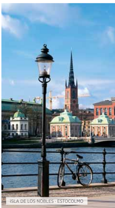
ISLA DE LOS NOBLES · ESTOCOLMO

*La visita al Artic Ice Bar y la visita opcional a la Isla de los Pájaros pueden variar el orden descrito en función de los horarios de las reservas.