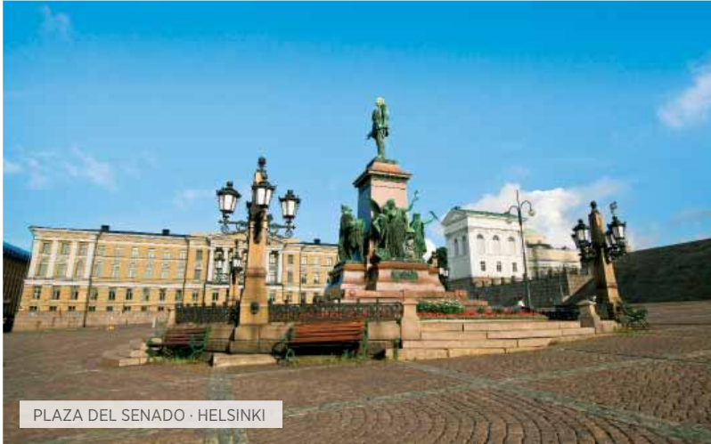
PLAZA DEL SENADO · HELSINKI