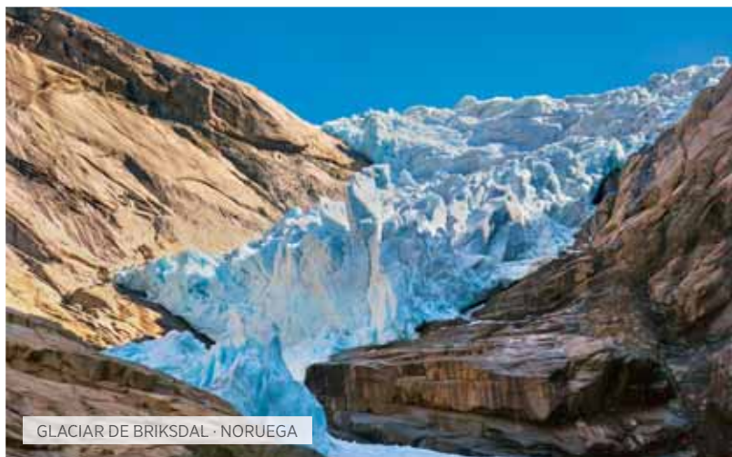
GLACIAR DE BRIKSDAL · NORUEGA