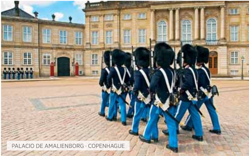
PALACIO DE AMALIENBORG · COPENHAGUE