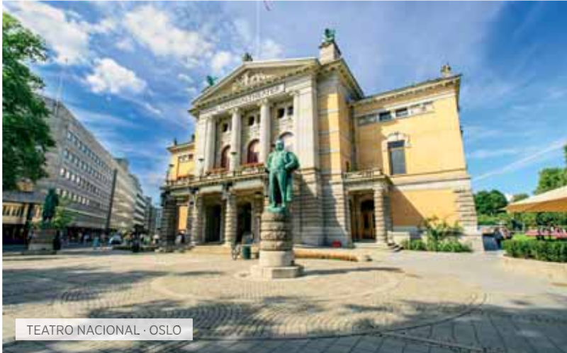
TEATRO NACIONAL · OSLO