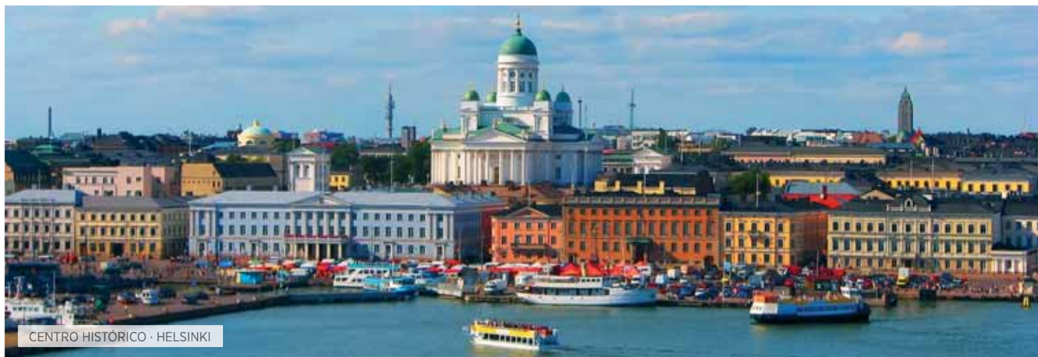
CENTRO HISTÓRICO · HELSINKI