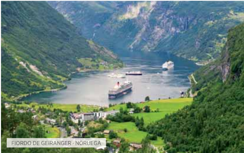
FIORDO DE GEIRANGER · NORUEGA