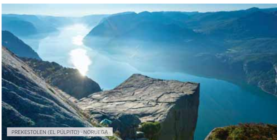
PREKESTOLEN (EL PÚLPITO) · NORUEGA

*La visita al Artic Ice Bar y la visita opcional a la Isla de los Pájaros pueden variar el orden descrito en función de los horarios de las reservas.