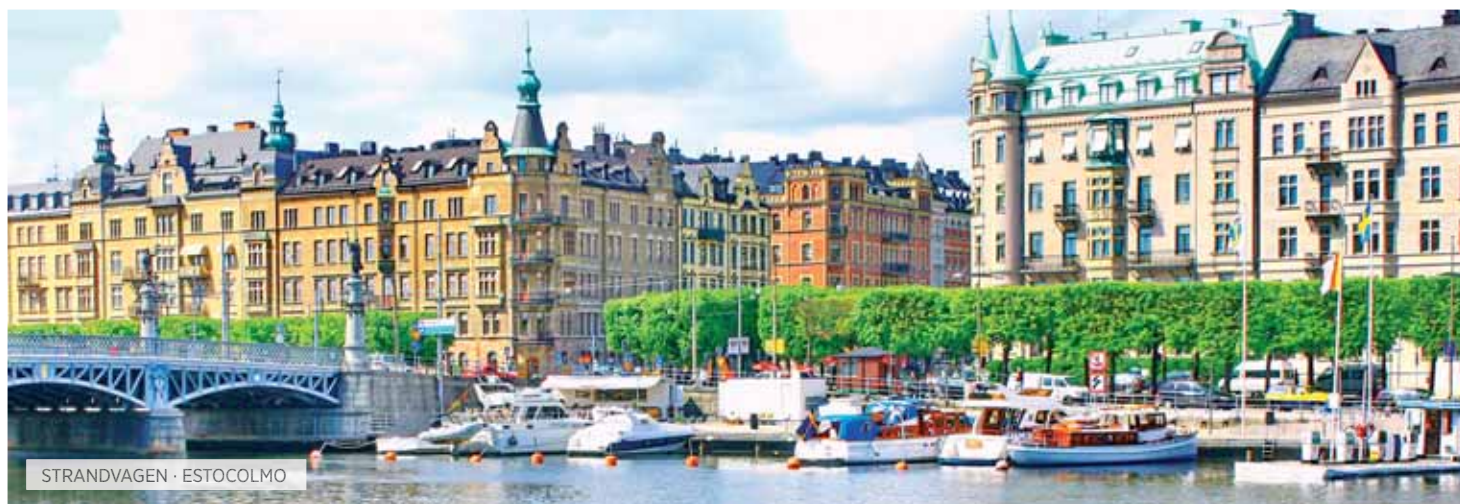
STRANDVAGEN · ESTOCOLMO