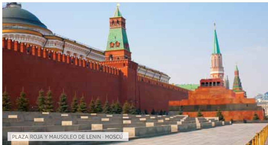
PLAZA ROJA Y MAUSOLEO DE LENIN · MOSCÚ

OTI Opción Todo Incluido S Special Selección