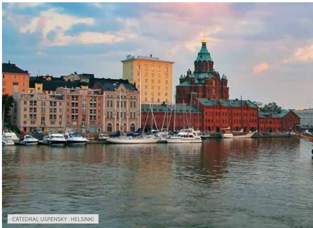
CATEDRAL USPENSKY · HELSINKI

Desayuno. Día libre o posibilidad de realizar una excursión opcional de todo el día a Tallinn (Estonia). Iremos en ferry hasta esta hermosa ciudad llamada "La Pequeña Praga", en la que realizaremos una visita de la misma, el Ayuntamiento; la Iglesia de San Olaf; el Castillo de Toompea, el Palacio