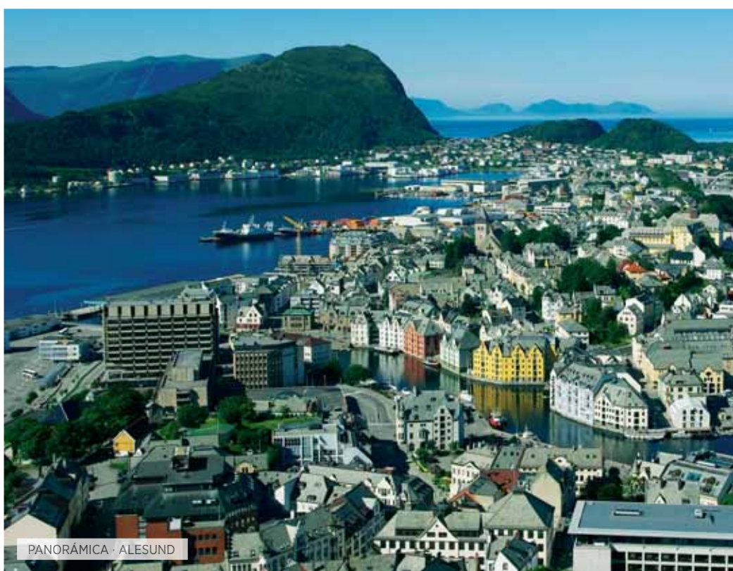
PANORÁMICA · ALESUND

Desayuno. Hoy nos espera un día inolvidable en el que realizaremos una excursión al Glaciar de Briksdal, situado en el Parque Nacional de Jostedalbreen, recomendamos calzado apropiado, ya que realizaremos una bellísima ruta de senderismo en el que disfrutaremos de la naturaleza, rodeados de montañas, cascadas y una riquísima vegetación hasta llegar a la lengua del glaciar. Una experiencia que dura unas horas, pero que conservará toda la vida en su memoria. Almuerzo. A continuación, si las condiciones meteorológicas lo permiten, realizaremos una excursión opcional en helicóptero, sobrevolando esta zona de fiordos