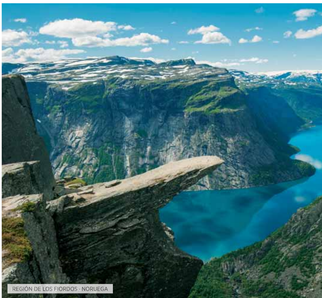
REGIÓN NACIONAL DE LOS FIORDOS · NORUEGA

Desayuno. En primer lugar realizaremos un paseo en barco por el Sognefjord, conocido como el Fiordo de los Sueños, que no solo es el más largo de Noruega con sus más de 200 kilómetros, sino también el más profundo alcanzando los 1.300 metros en algunos lugares. Almuerzo y continuación, pasando por el Valle de Voss hasta Bergen. Visita panorámica en la que conoceremos entre otros lugares el Viejo Puerto de Bryggen, el antiguo barrio de los comerciantes de la Liga Hanseática y sus construcciones en madera, y subiremos a la colina Floyfjellet en funicular, para apreciar