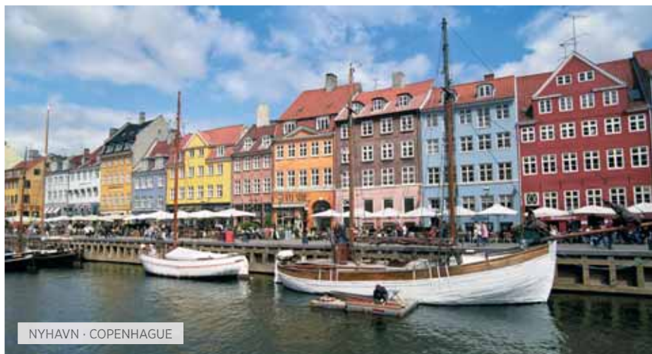
NYHAVN · COPENHAGUE