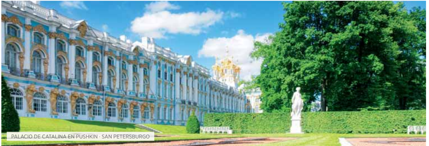
PALACIO DE CATALINA EN PUSHKIN · SAN PETERSBURGO