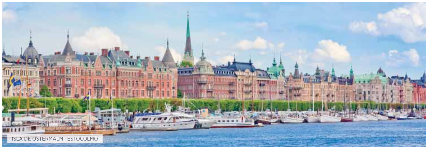
ISLA DE OSTERMALM · ESTOCOLMO