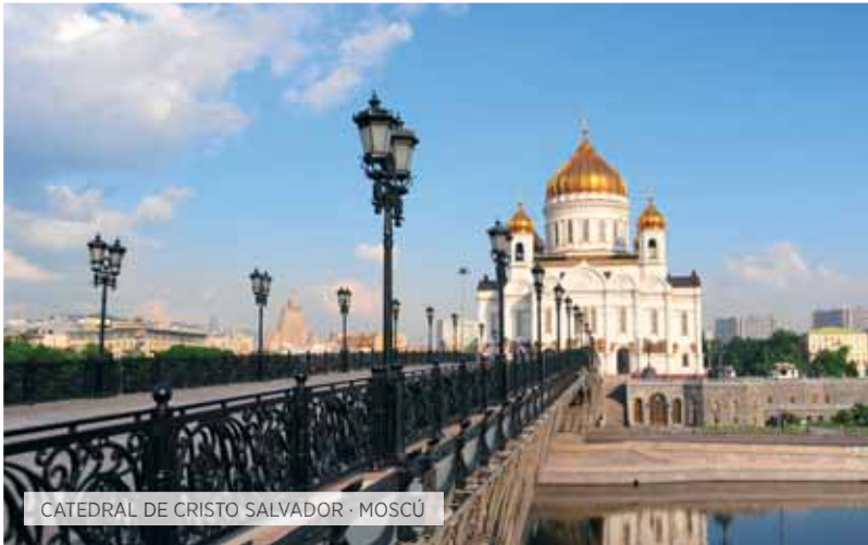
CATEDRAL DE CRISTO SALVADOR · MOSCÚ