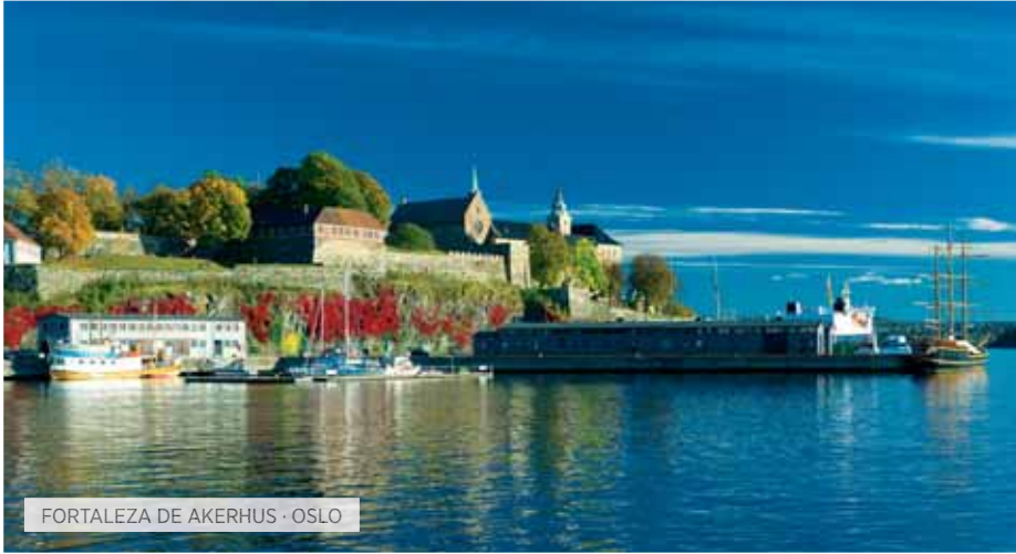
FORTALEZA DE AKERHUS · OSLO