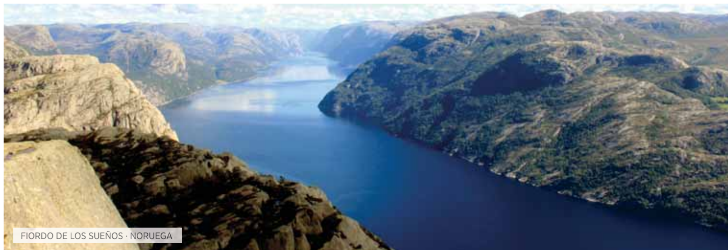
FIORDO DE LOS SUEÑOS · NORUEGA