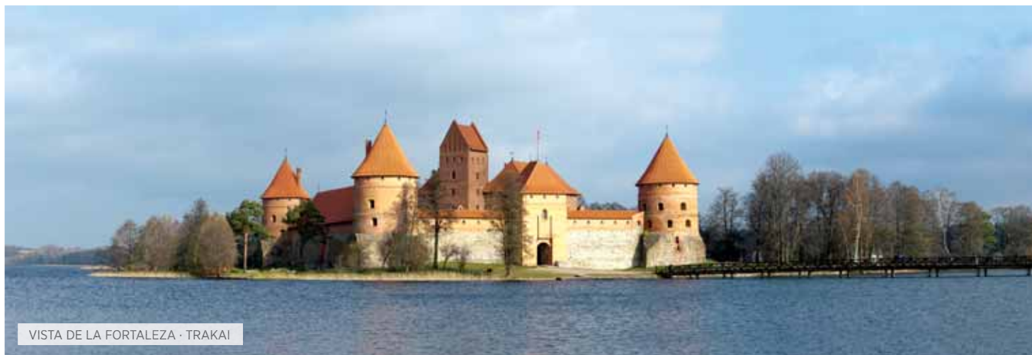
VISTA DE LA FORTALEZA · TRAKAI