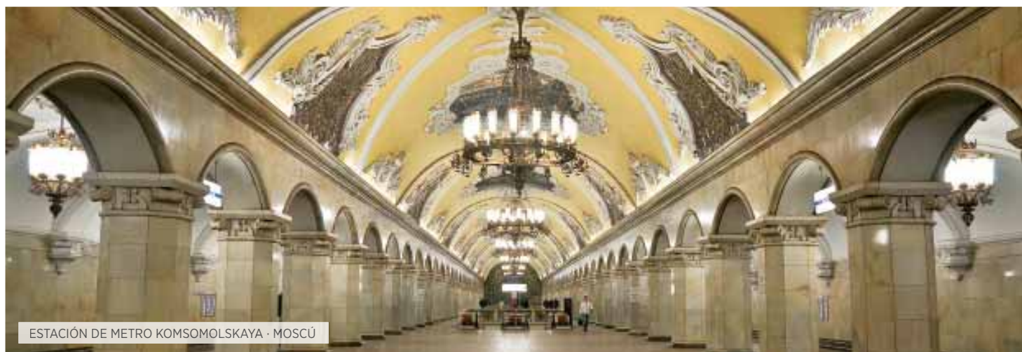
ESTACIÓN DE METRO KOMSOMOLSKAYA · MOSCÚ