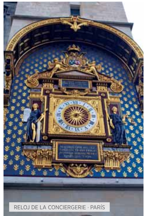
RELOJ DE LA CONCIERGERIE · PARÍS

Desayuno. Visita panorámica: El Monasterio de los Jerónimos, la Torre de Belem, el Monumento a los Descubridores, Alfama las Plazas del Comercio, del Rossio y