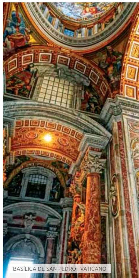
BASÍLICA DE SAN PEDRO · VATICANO

Desayuno. Día libre para seguir conociendo esta maravillosa ciudad. Si lo desean podrán hacer una excursión en la que nos dirigiremos a la Campania, visitando Pompeya y los magníficos restos arqueológicos de esta ciudad romana parada en el tiempo por la erupción del Vesubio en el año