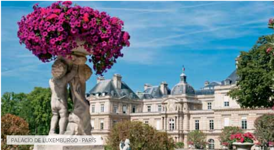
PALACIO DE LUXEMBURGO · PARÍS

V. Inter-europeo Incluido T Special Tentación S Special Selección