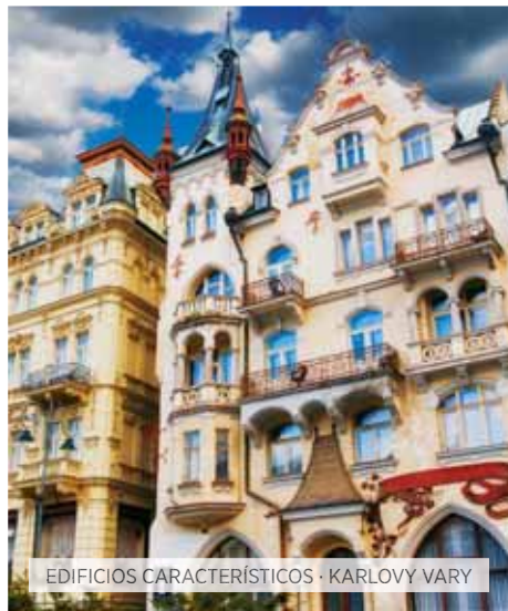
EDIFICIOS CARACTERÍSTICOS · KARLOVY VARY

Desayuno. Tiempo libre hasta la hora que se indique para traslado al aeropuerto para tomar el vuelo hacia Praga.