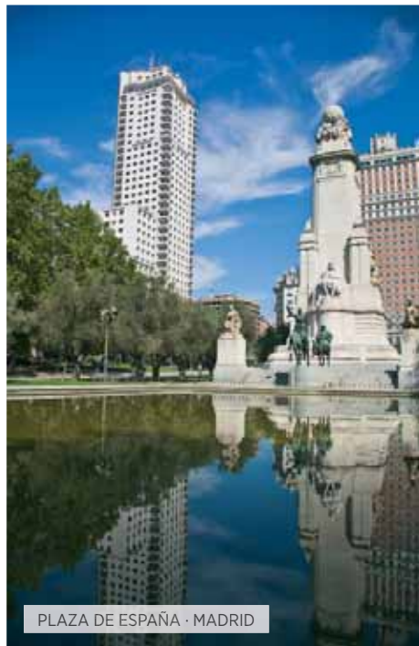
PLAZA DE ESPAÑA · MADRID

Desayuno. Visita panorámica de la capital del Reino de España, ciudad llena de contrastes, en la que con nuestro guía