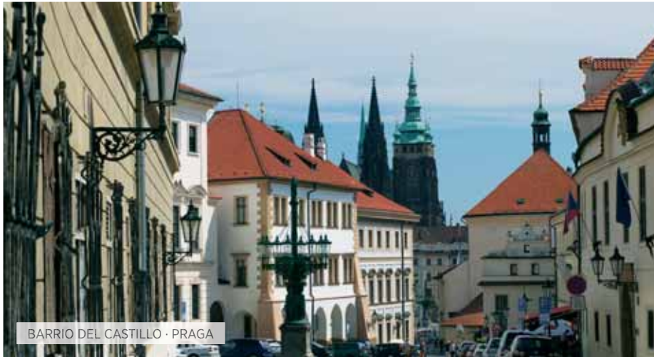
BARRIO DEL CASTILLO · PRAGA

V. Inter-europeo Includido T Special Tentación S Special Selección