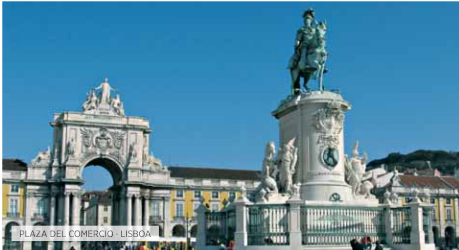
PLAZA DEL COMERCIO · LISBOA