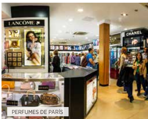
PERFUMES DE PARÍS

Desayuno. Tiempo libre hasta el traslado al aeropuerto para volar a su ciudad de destino y fin de nuestros servicios.