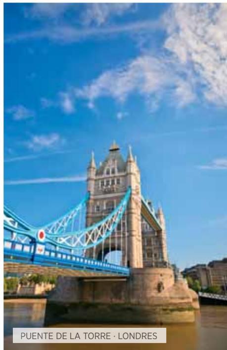
PUENTE DE LA TORRE · LONDRES

Tiempo libre hasta la hora de traslado al aeropuerto para tomar el vuelo a Lisboa. Llegada y traslado al hotel. Resto del día libre para un primer contacto con la bella capital lisboeta, y disfrutar de su gente, sus plazas y rincones. Cena y alojamiento.