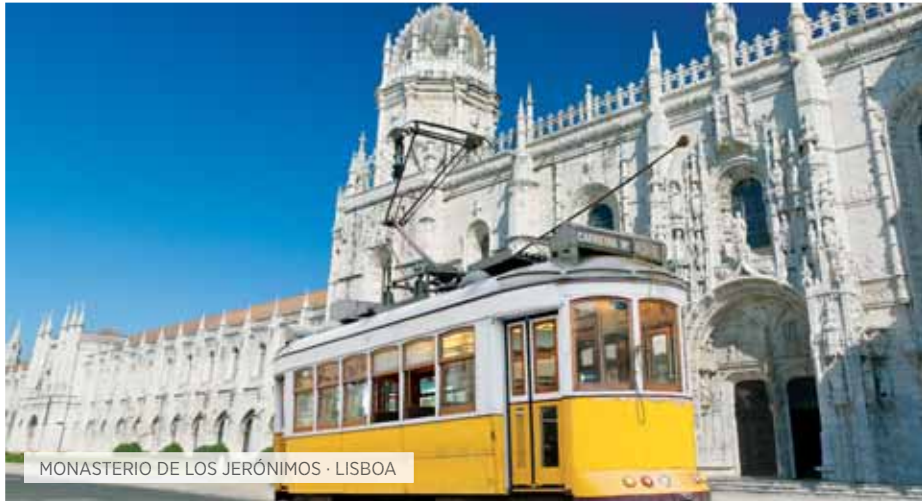
MONASTERIO DE LOS JERÓNIMOS · LISBOA

V. Inter-europeo Incluido T Special Tentación S Special Selección