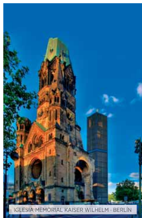
IGLESIA MEMORIAL KAISER WILHELM · BERLÍN

Desayuno. Visita panorámica de lo más característico de la capital de Alemania: veremos la Iglesia Conmemorativa del Kaiser Guillermo, la Isla de los Museos, la famosa avenida Kudamm, Alexander Platz, el barrio de San Nicolás, la plaza de la Gendarmería, los restos del Muro, la avenida de Unter