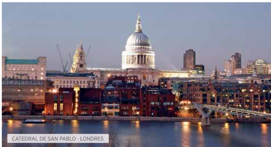
CATEDRAL DE SAN PABLO · LONDRES

V. Inter-europeo Incluido Special Tentación