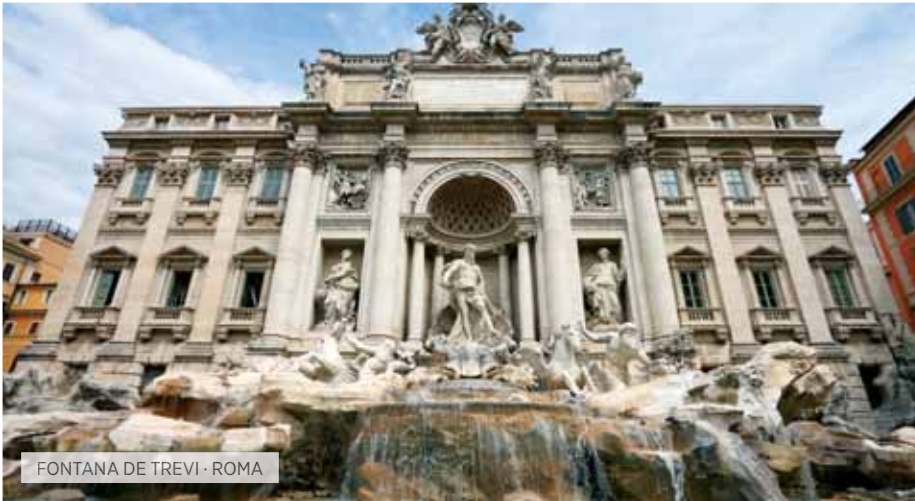
FONTANA DE TREVI · ROMA