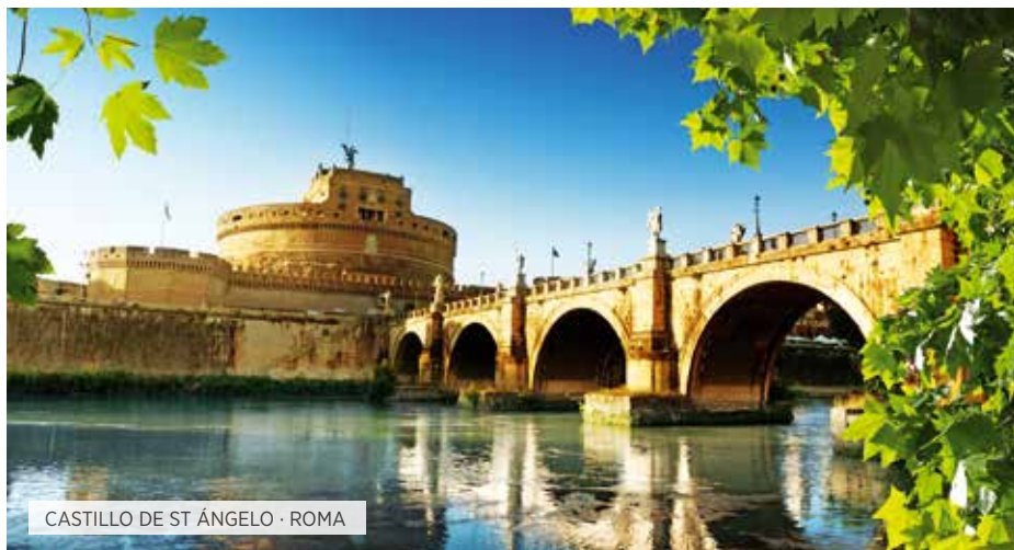
CASTILLO DE ST ÁNGELO · ROMA