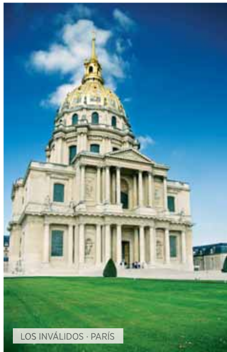
LOS INVÁLIDOS · PARÍS

Desayuno. Visita panorámica de lo más característico de la capital de Alemania: veremos la Iglesia Conmemorativa del Kaiser Guillermo, la Isla de los Museos, la famosa avenida Kudamm, Alexander Platz, el barrio de San Nicolás, la plaza de la Gendarmería, los restos del Muro, la avenida de Unter