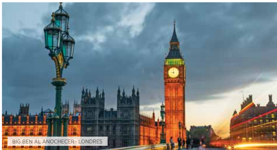
BIG BEN AL ANOCHECER · LONDRES