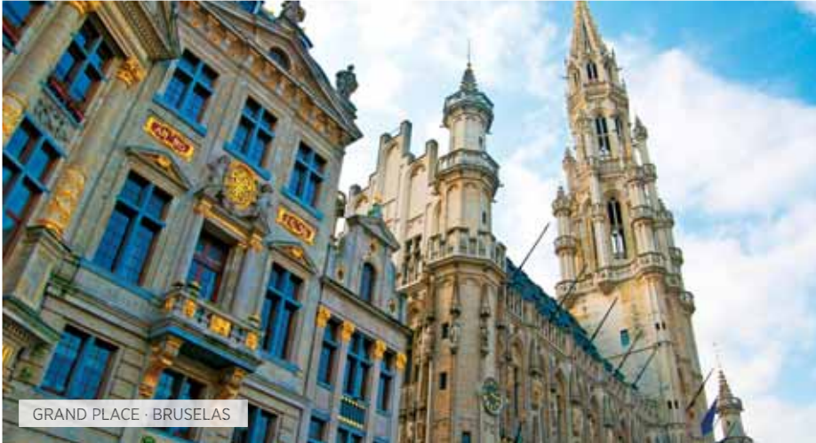
GRAND PLACE · BRUSELAS