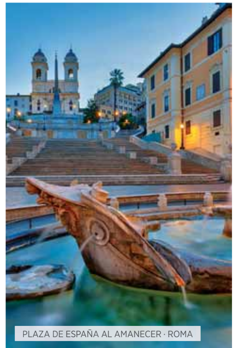
PLAZA DE ESPAÑA AL AMANECER · ROMA

Desayuno. Visita panorámica: la Grand Place, con las Casas del Rey, de los Gremios y, sobre todo, el Ayuntamiento; el Maneken-Pis; estatua de bronce de unos cincuenta centímetros; Barrio de Sablon, el Palacio de Justicia, el Atomium, etc. A continuación realizaremos un recorrido por dos ciudades espectaculares. Brujas, en la que disfrutará descubriendo el encanto de sus casas y canales, el Lago del Amor, el Beaterio, la Plaza Grote Markt, la Basílica de la Santa Sangre, del siglo XII, donde se guarda la reliquia de la Santa Sangre de Jesucristo, etc. Seguidamente realizaremos una parada en Gante, con mágicos rincones como el Castillo de los Condes de Flandes, la Catedral de San Bavón,