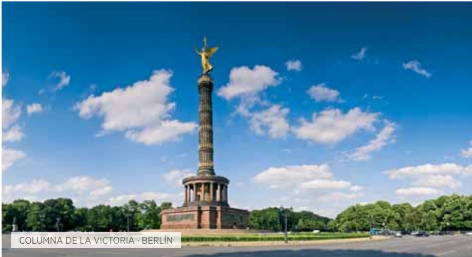
COLUMNA DE LA VICTORIA · BERLÍN