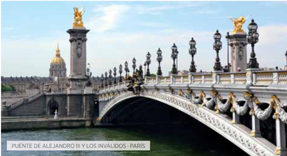
PUENTE DE ALEJANDRO III Y LOS INVÁLIDOS · PARÍS